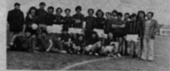
SWELL ve NAZUS TAKIMLARI