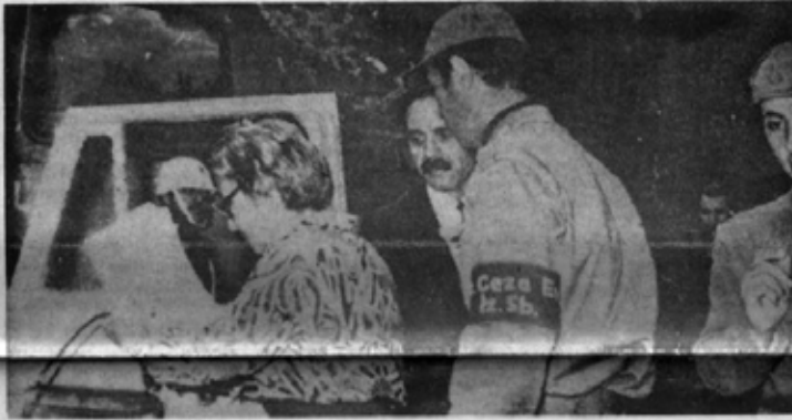
DEVRİMCİLERE ÖRNEK OLDU