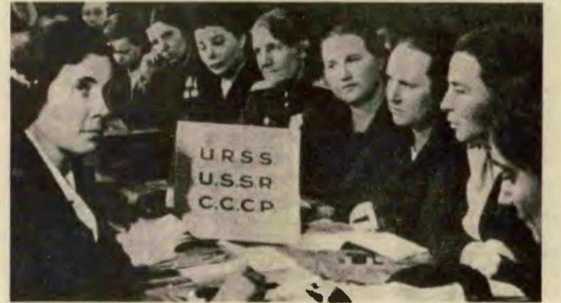
DDKF'NİN KURULUŞ TOPLANTISINDA SOVYET DELEGASYONU

Eşitlik, barış, bağımsızlık için mücadele veren Dünya Demokratik Kadınlar Federasyonu (DDKF), 1 Aralık'ta kuruluşunun 30. yıldönümünü kutlayacak.