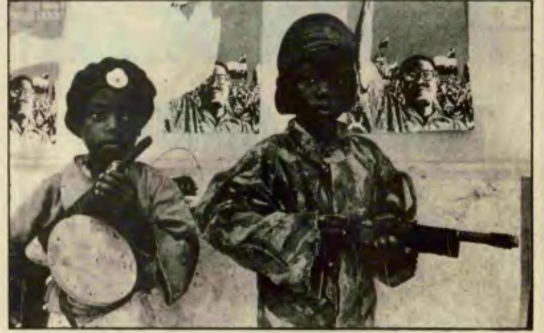
MPLA'NIN KÜÇÜK SAVASÇILARI

Emperyalizm, kendi çıkarlarına ters düşen MPLA hükümetini devirmek amacıyla, bölgedeki en gerici unsurlarla işbirliği yaparak saldırılarını artırdı. Kendilerine "Kurtuluş Örgütü" adını yakıştıran FNLA ve UNITA gibi maşa örgütleri kullanarak bu amacını gerçekleştirmeye çalışıyor. Bugün, birçok ülkede yayınlanan gazeteler, bu örgütlere Birleşik Amerika'nın ve Çin'in büyük ölçüde silah verdiğini açık açık yazıyorlar.