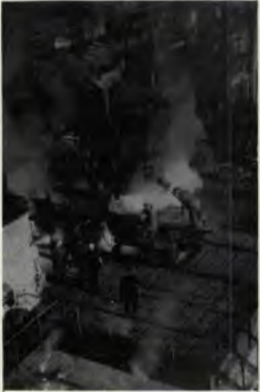
"AMURSTAL" ÇELİK FABRİKASI

Bugün dünyadaki maddi değerlerin 1/5'i Sovyetler Birliği'nde üretilmektedir. Ve tüm bu başarılarıyla Sovyet halkı, sosyalizmin, komünizmin kapitalizme olan üstünlüğünü gözler önüne seriyor.