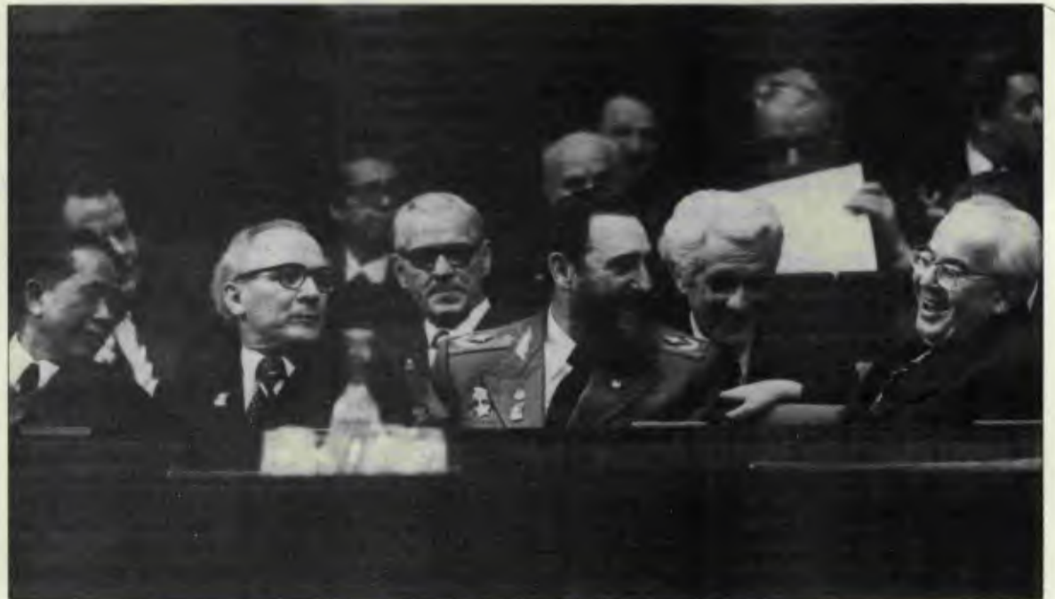
SBKP 25. KONGRESİ PREZİDYUMUNDA KARDEŞ PARTİLERİN DELEGELERİNDEN BİR GRUP: (soldan sağa) GUSTAV HUSAK, ALVARO CUNHAL, FİDEL CASTRO, WILLI STOPH, ERICH HONECKER ve LE DUAN

zere seferber oldu. Şimdi Sovyetler Birliği'nde üretimin her dalında, her bir biriminde Sovyet işçileri, emekçileri 10. Beş Yıllık planın hedeflerini gerçekleştirmek, hattâ aşabilmek için kendilerine düşen görevleri gözden geçiriyorlar. Barıştan, demokrasiden ve toplumsal ilerlemesinden yana, hangi ulustan, hangi ırktan olursa