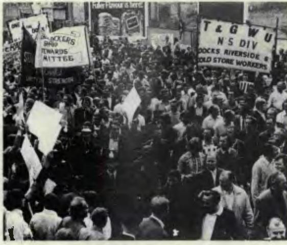
DOK İŞÇİLERİNİN YIĞINSAL BİR EYLEMİ

Öte yandan 6 martta Brüksel'de yapılan Ortak Pazar ülkeleri toplantısında alınan yeni bir kararlar, peynir, tereyağ, süt, sığır eti ve daha birçok gıda maddeleri -nin fiyatlarının arttırılması kararlaştırıldı. Britanya Ortak Pazar'a girdiğinden bu yana sadece Ortak Pazar fi-