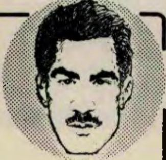
İKP'İN KURUCUSU FAHİD YOLDAŞ

Irak Komünist Partisi'nin Britanya örgütü, 10 nisan 1976 cumartesi günü Londra'da, Irak Komünist Partisi'nin kuruluşunun 42. yılını kutlamak üzere bir toplantı düzenledi. Portekiz Komünist Partisi, AKEL, Sudan Komünist Partisi, İspanya Komünist Partisi, Guyana İlerici Halk Partisi, Filistin Kurtuluş Örgütü'nün İngiltere şubeleri temsilcileriyle Britanya Komünist Partisi'nin temsilcileri de katılarak dayanışma mesajları okudular. Ayrıca İngiltere Türküyelili İ