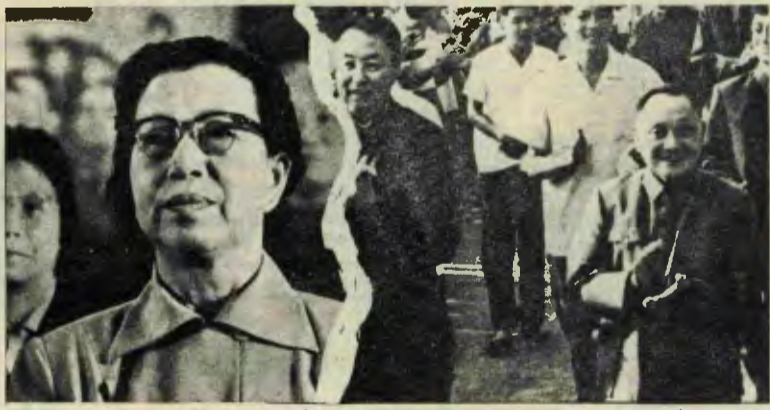
MAO'NUN KARISI ÇIYANG ÇİNG, BAŞBAKAN HUA VE PRAGMATİST DANG

Bu gelişmeler, Çin'de çeşitli klikler arasındaki iktidar mücadelesinin giderek keskinleştiğini gösteriyor. Bu iktidar mücadelesi yeni bir olgu değildir. Yeni olan geniş kitlelerin de bu mücadelede etkilenmesi, bu mücadelede katılımıdır. Pekin'de yapılan gösterilere onbinlerce kişinin katılması bunları doğruluyor.