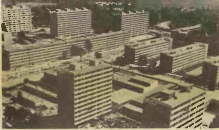
POLONYA'DA II. DÜNYA SAVAŞININ YIKTIĞI ŞEHİRLERDE ŞİMDİ MODERN KONUTLAR YÜKSELİYOR

POLONYA HALK CUMHURİYETİ, BUNDAN 32 YIL ÖNCE, 22 TEMMUZ 1944'DE KURULMUŞTUR. AŞAĞIDA, POLONYA BU BÜYÜK YILDÖNÜMÜNDE PHC BAKANLAR KONSEYİ BAŞKANI PİOTR JAROSZEWICZ'IN YAPTIĞI KONUŞMANIN ÖZETİNİ SUNUYORUZ: