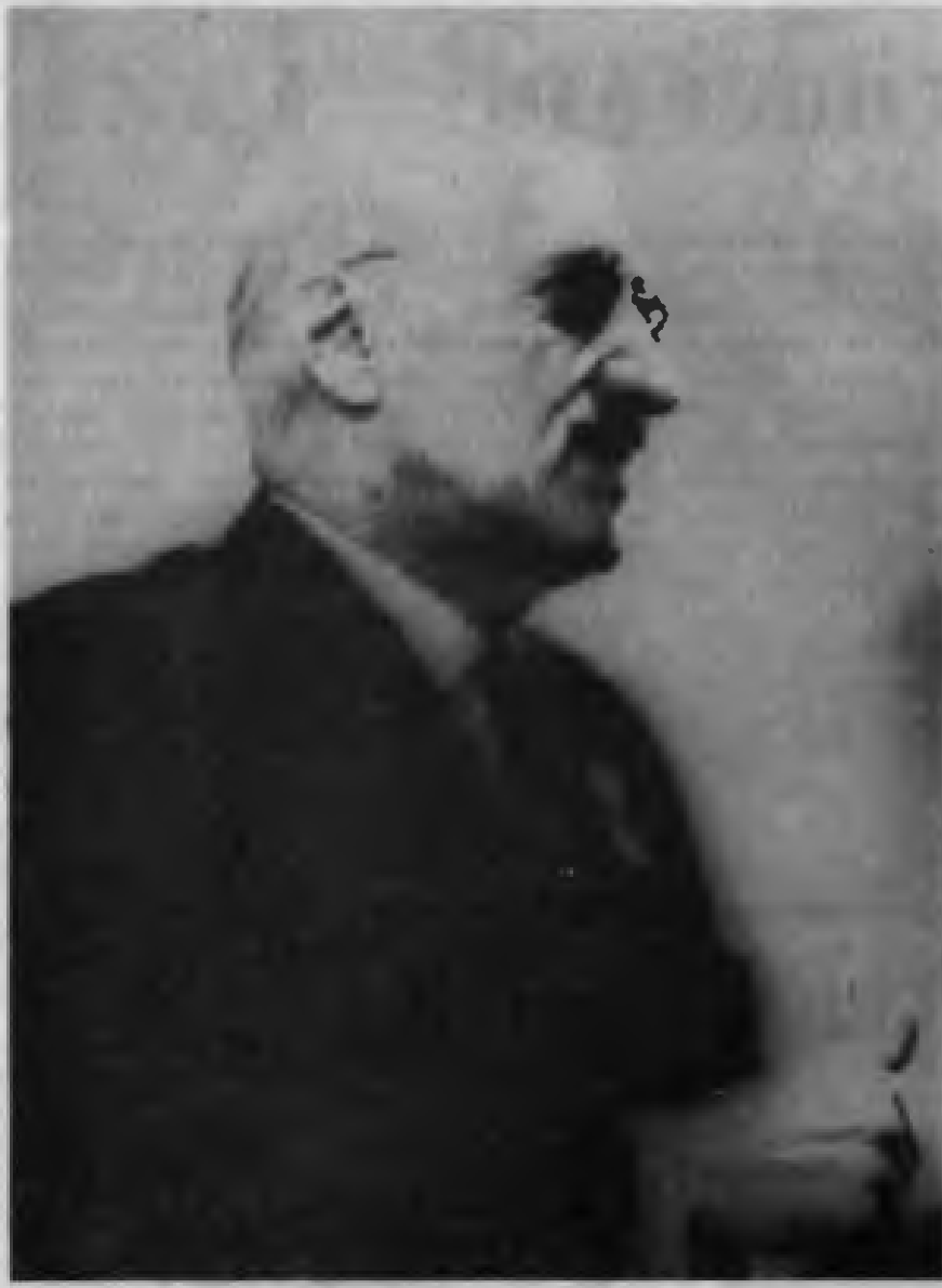
TKP GENEL SEKRETERİ İ. BİLEN