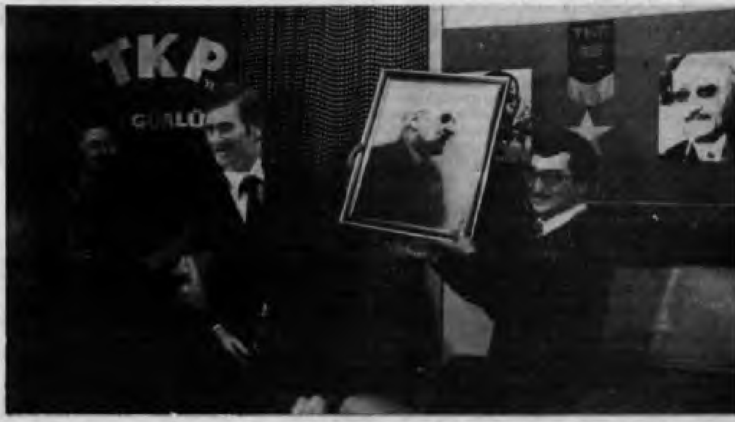
Yaz Taarruzu sonunda çeşitli övüldü.

Böylece, on haftalık öğretici, eğitici, unutulmaz bir deneyim geçirdik. Yaz Taarruzu hem