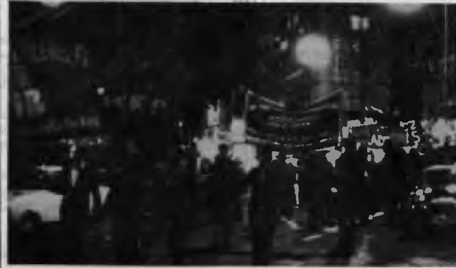
Londra'da düzenlenen meşaleli protesto yürüyüşünden bir görünüş...

İNGİLTERE Türkiye İleri-ciler Birliği (İTİB), Öğrenci Federasyonu (İTÖF) ve Kadınlar Birliği (İTKB)'nden oluşan "2. MC'ye Direniş Komitesi", 2 Eylül Cuma akşamı 2. MC'ye karşı büyük bir yürüyüş düzenledi. Hyde Park'la Türkiye Büyükelçiliği arasında yapılan meşaleli yürüyüşe Türkiye işçi ve öğrencilerin yanısıra Kıbrıs Türk Demokrasi Derneği, Yunanistan Komünist Gençlik Birliği'nin (KNE) İngiltere örgütü, Şiiili, Iraklı ve Portekizli devrimciler de katıldı.