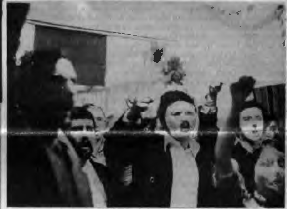
Toplantıdan bir an