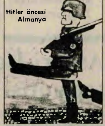
Hitler öncesi Almanya

Almanya Komünist Partisi, Almanya'da faşizm tehlikesini daha 1920'lerin başlarında gördü. 1919'daki dünya ekonomik bunalımıyla tehlike iyice keskinleşmişti. Ernest Thaelmann'ın