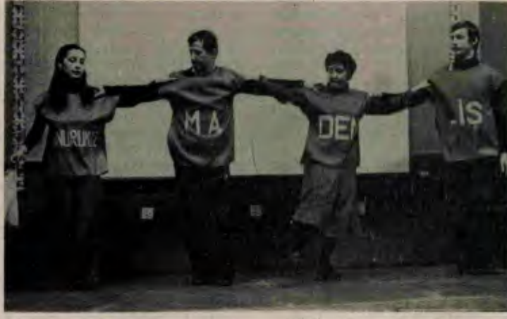
İşçi gecesinden iki görünüşü

İngiltere'deki işçilerimizin bu eylemi gerek Maden-İş'li grevcilerin davasını duyurma açısından, gerekse örgütlenme açısından önemli bir adım oldu.