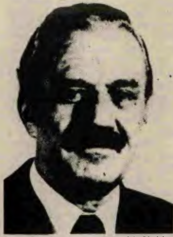
KKE Genel Sekreteri Florakis Yoldas

1968'de KKE'den ayrılarak, daha doğrusu, temizlenerek "İç Komünist Partisi" (!) adıyla piyasaya çıkan oportünistler seçimlerde ağızlarının payını aldılar. "Avrupa komünisti" bu parti, sıra sıra bağlaşıklarıyla birlikte oyların ancak %2.7'sini alabildi. "İki Parti Sorunu" (?) ile ilgili bir soruya basın toplantısında KKE Genel Sekreteri Florakis şöyle yanıt verdi: Dünyanın hiç bir yerinde iki parti olamaz. Biz bu sorunun çözümü için işçi sınıfına güvendik... Nitekim, ötekiler çoktan belalarını buldular.... Gerçekten de Yunanistan işçi sınıfı bu "iç" partiyi elinin tersiyle dışlayıverdi, tek öncü partisi KKE'ye sahip çıktı. Yine aynı basın toplantısında sorulan "KKE artık kapılarını daha