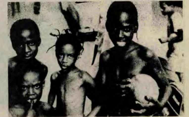
Angola'da resimdeki gibi çocuklar artık işte çalışmak zorunda değil. Genel eğitimi yaşama geçirmek için savaşın yürütülüyor.

Sovyet TASS ajansı, Angola üzerine yayımladığı yorumunda, 1976 temmuzunda Zürih'de yaptıkları gizli bir toplantıda Kissinger, NATO Avrupa Kuvvetleri Komutanı General Haig ve Güney Afrika Başbakanı Vorster'in, Angola hükümetini devirmek için gizli bir operasyon planladıklarını açıkladı. Ayrıca TASS, Angola'daki karşı devrimci UNİTA hareketine silâh verdiği için CIA'yı suçladı.