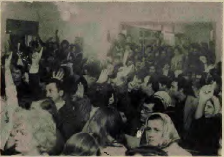
Recklinghausen İşçi Derneği'nin kuruluş toplantısından bir an

Komite yayımladığı bildiri- de şöyle diyor: "Yıllardır sorunlarımızı hiçbir çözüm getirmeyen, bizleri sadece döviz yumurtlayan tavuk gibi gören bu halk düşmanı hükümet yıkılıp yerine halktan yana bir hükümet kuruluncaya kadar mücadelemizi sürdüreceğiz."