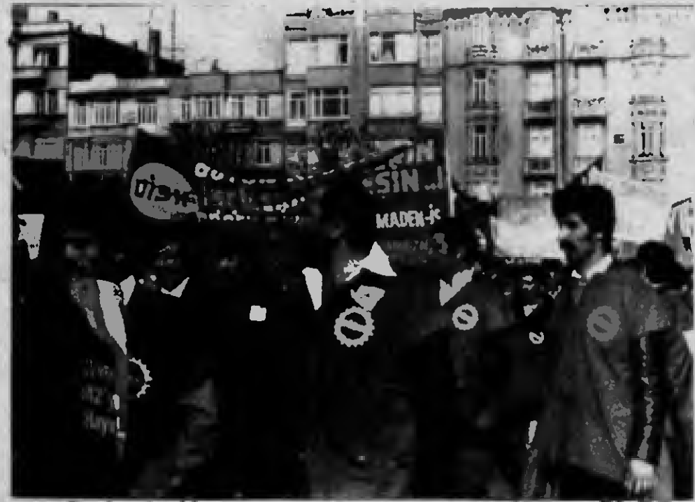
Şanlı 1 Mayıs gösterilerinde işçi sınıfımız ATILIM'ın belgileriyle yürüdüler.

TKP illegal bir partidir. Koşulların elverdiği ölçüde, gizlilik koşullarına kesinlikle uymakla işçilerden Atılım'a toplanan, yollanan bağışlar, onun güçlenmesine, yığinsallaşmasına zorlukları yenmesine büyük bir destek olacaktır.