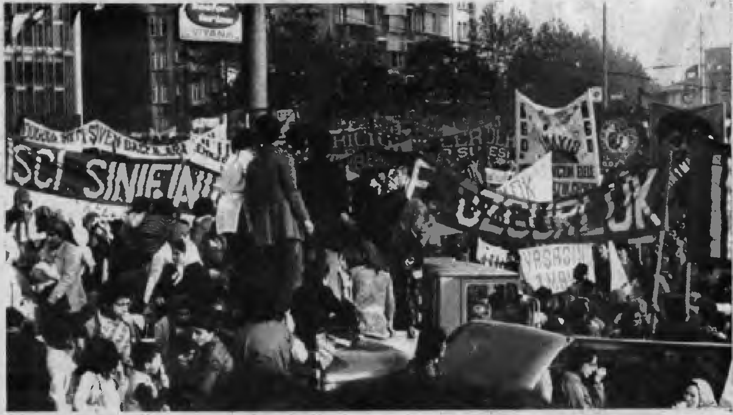
TKP'nun, "Atılım"ın belgileri yığınlara maloluyor.

3) Yerel yayınlarda Merkez organdan sık sık alıntılar yapmak, yığınları Merkez organın adına alıştırmak. Böylece yığınlarda kendi sürekli gazetelerinin, ideolojik merkezlerinin olduğu fikrini uyandırmak. Bu tüm etki alanımızı genişletmemiz için en önemli bir noktadır. (Lenin, Toplu Yapılar . c.9, s.288-299).