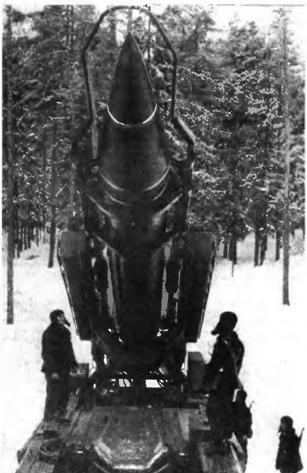
Kızıl Ordu'da cesaret ve teknoloji bir hütündür

Kuruluşunun 60. yıldönümünde Şanlı Kızıl Ordu'ya Selâm!