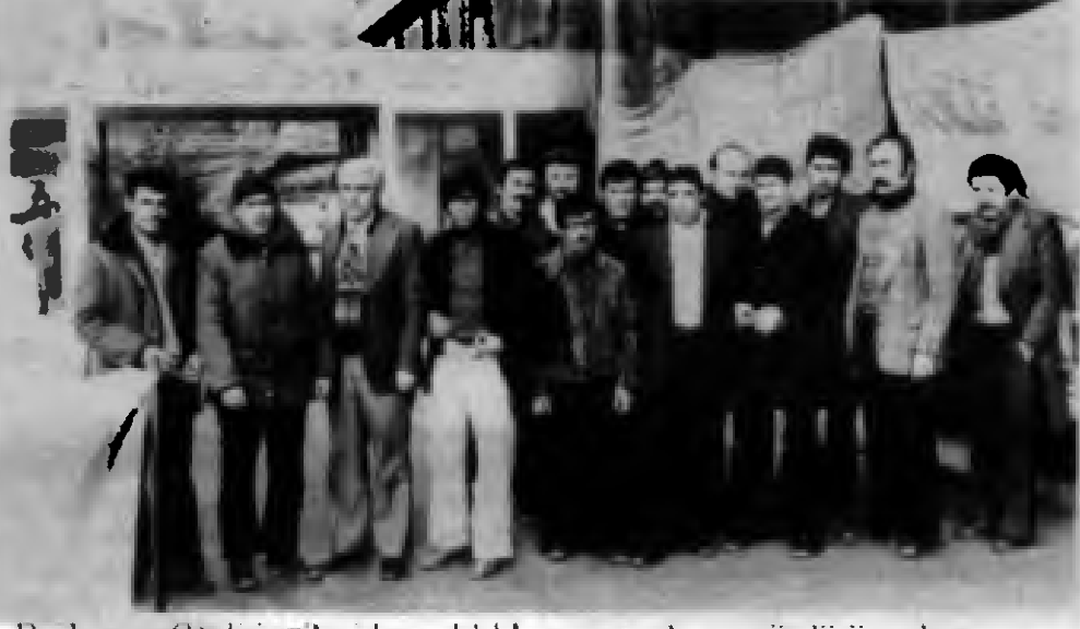
Dedeman Oteli işçileri kararlılıkla savaşımını sürdürüyorlar