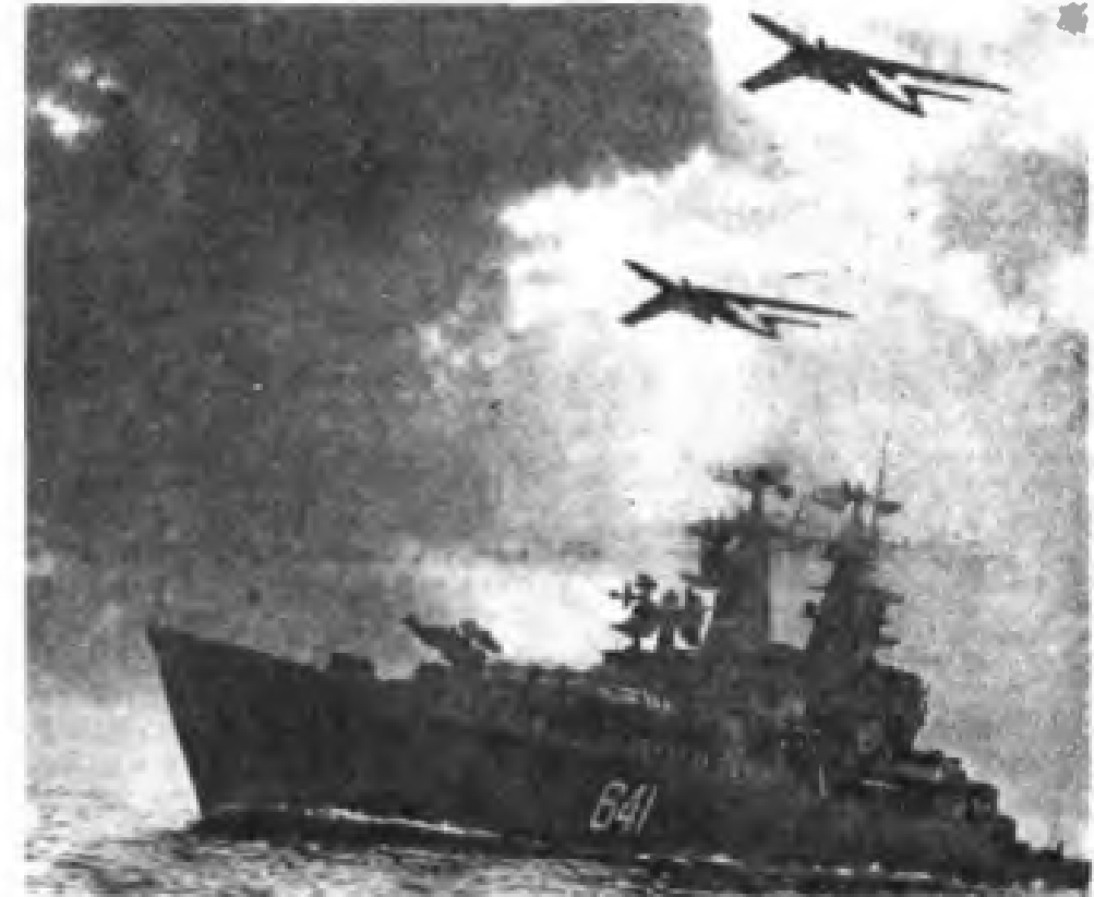
Bir deniz manevrasında Kızıl ordu uçakları ve destroyeri