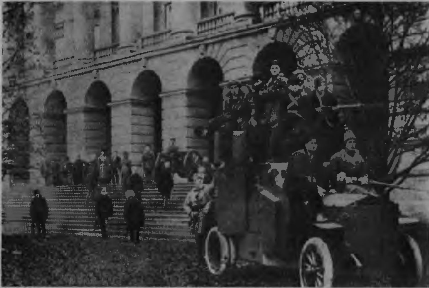
Büyük Ekim Devrimi günlerinde Smolny’nin önü