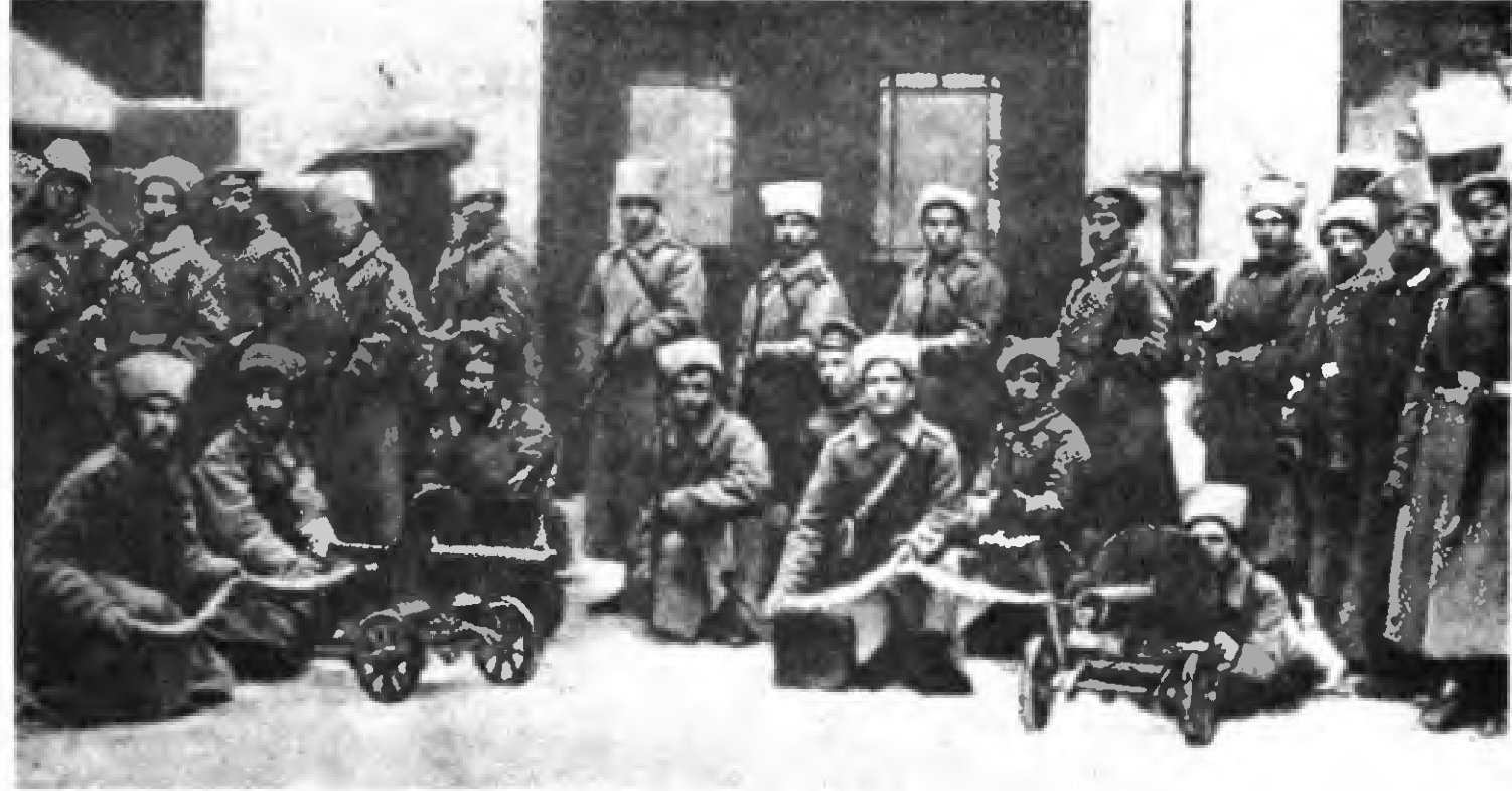
Petrograd 1917-Ekim silahlı ayaklanmasına katılan birliklerden Kelsgolm Birliği'nin askerleri

Emperyalist saldırı kızıştı-ğında Kızıl Ordu'yu daha da güçlendirmek için Nisan 1918'de ülke çapında askerlik hizmeti zorunlu koşıldı. Yine işçiler, köylüler yurtlarını ve devrim kazanımlarını savunmak için cepheye koştular. Modern silâhlarla donatılmış, kendilerinden çok güçlü Beyaz Ordular'ı, Antant Ordular'ını yerle ettiler. Bu utkunun başlıca nedeni, Kızıl Ordu'nun kurtulmuş, devrim