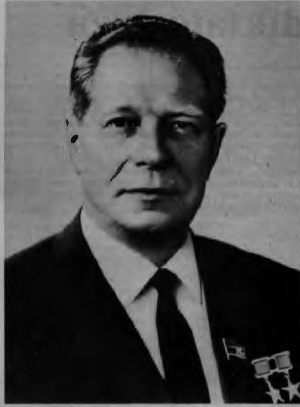
Sovyetler Birliği Savunma Bakanı ve SBKP MK Politbüro üyesi Mareşal Ustinov

“Sovyet devletinin başarıları, Sovyet iktidarını daha beşikleyen boğmaya çalışanlara rahat vermiyordu. Emperyalistlerin kampında, dünyanın ilk sosyalist ülkesine karşı yeni saldırgan eğilimler olgunlaşıyor, onu yok-