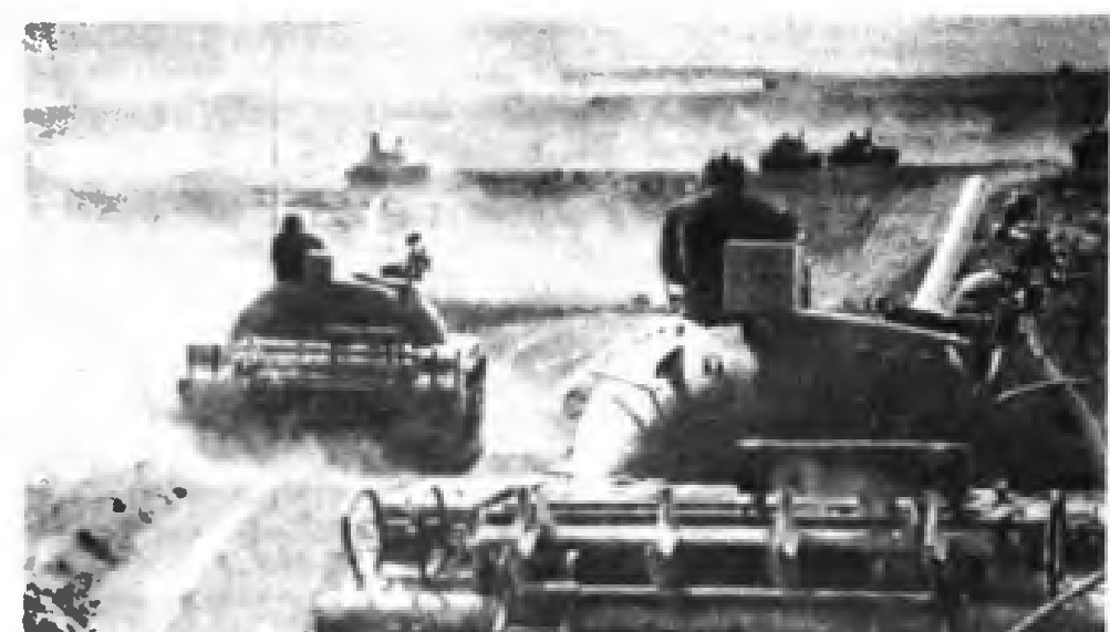
Kızıl Ordu tankları bir manevra sırasında