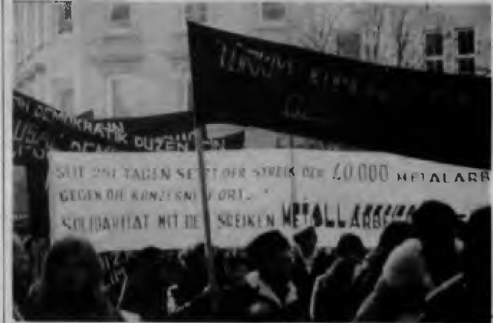
Yurt dışındaki işçilerimiz de Türkiye toplumunun en demokratik istemini yükseltiyorlar.

Stuttgart Muhabirimiz bildiriyor Federal Almanya'nın Stuttgart kentinde geçtiğimiz ay içinde "Meslek Yasası Kanunu"nu protesto yürüyüşü yapıldı. Alman Komünist Partisi (DKP)'nin örgütlediği yürüyüşte, ilericilere uygulanan meslek yasalarının derhal kaldırılması istendi.