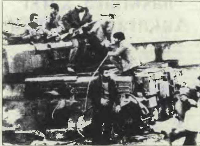
İran devrimi zorlu ve kararlı bir savaşla gerçekleşti

1974'te Tahran yakınlarında Manatab "Land Rover" montaj fabrikasında işçiler iş yavaşlatarak üretimi dörtbuçuk ay süresince %50 oranında düşürdüler. Eylem, polis fabrikaya saldırması ve çok sayıda işçinin tutuklanmasıyla kırıldı.