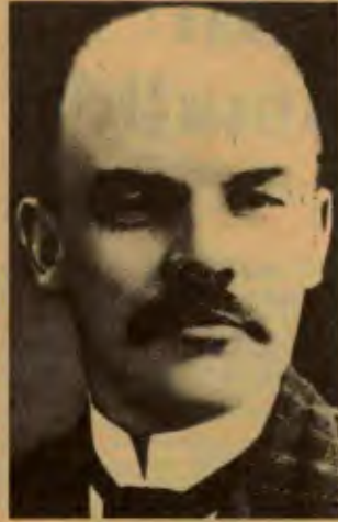
V.I. Lenin RSDİP 4. Kongresi'nde (Stokholm 1906)

tinde geneliyle barışçıl gelişme dönemidir. Avrupa'da kapitalizmin barışçıl gelişme dönemidir. Barışçıl gelişme dönemi de ayne devrimci durum gibi kendine uyumlu taktikler ister. Böylesi dönemlerde halkı sokaklara dökmeyiz. Yapabileceğin tek şey, gelecek devrimci dönemin hazırlığıdır. Ağır, yavaş, sabırlı bir çalışmadır. Küçük ve geçici çıkarlar için savaşım, reformlar isteğine daha bir ağırlık verme Kuşkusuz bunları yine devrim savaşıyla bağlama.