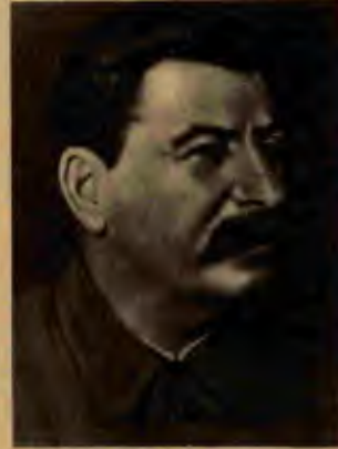
Josef Vissarionoviç Stalin

Tum bu olağanüstü başarılar Stalin'e parti içinde, Sovyet halkı ve dünya halkları arasında büyük saygı ve sevgi kazandırdı. "Belli bir aşamada bu prestij kişiyi putlaştırılmaya dönmeğe başladı" ( Markist-Leninist Felsefenin Temelleri , İngilizce basım, Moskova 1974, s.571). Bunda tarihsel, ekonomik, toplumsal, sosyo-psikolojik nedenler en başta rol oynadı.