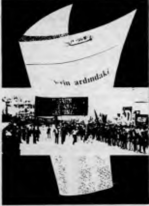
Türkiye devrim hareketinin tek İngilizce aylık dergisi "Turkey Today"ın son sayısı çıktı.