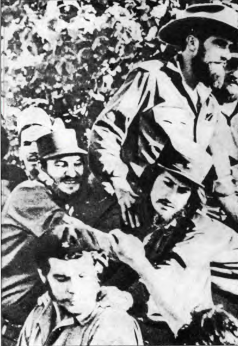
Devrimin "büyük dörtlüsü", Fidel Castro, Raul Castro, Camilo Cienfuegos ve Che, zaferle sonuçlanan boydan boya Küba yürüyüşlerinden sonra Havana'da coşkunun bir biçimde karşılanıyor.