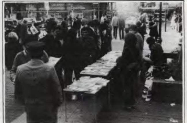
Leninciler Avrupa’da da hızlı bir çalışma içinde. Resimde Hamburg’daki yoldaşlarımızın kentin ana meydanlarından birinde kurdukları yayın satışı sergisi görülüyor. Sergide Türkçe, İngilizce ve Almanca yayınlar yer alıyor. Böylece sergi hem Türkiyeliler arasında gazetenin dağıtımına, hem de faşist cuntanın Alman kamuoyunda sergilenmesine yardımcı oluyor.