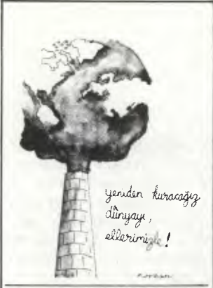
YAŞASIN DÜNYA İŞÇİ SINIFININ BİRLİK VE DAYANIŞMA GÜNÜ

burjuva devrimcilerinin, sıra sıra açıklamaları yer alıyor. Dev-Sol'un MK'ya bağlı bir bölge sekreteri televizyona çıkıp "yaptıklarımız sözde güzelse de, hayalden başka birşey değil" diyebiliyor. Bu bölge sekreterine bağlı çalışan bir sorumlu da "biz aldatılmış insanlarız, pişmanım, bundan sonra vatana ve millete hizmet etmek amacındayım" diye açıklamada bulunuyor. Bunlar devrimci hareketi karalayamayacaktır çünkü halk, binlerce devrimcinin türlü işkence altında konuşmadığını biliyor.