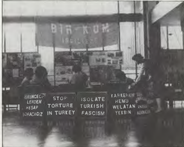
Resimde Londra'daki açlık grevine katılan bir gurup İşçinin Sesi militanı görülüyor. ITV televizyonu açlık greviden görüntüleri bugün en önemli ve ülke çapında haber bülteni olan 22.00 haberlerinde verdi. Bu grevin amaçlarını yaymak açısından önemli etki yaptı.

eyleminin parçası olan 10 Haziran yürüyüşüne katılım da büyük bir başarı oldu.