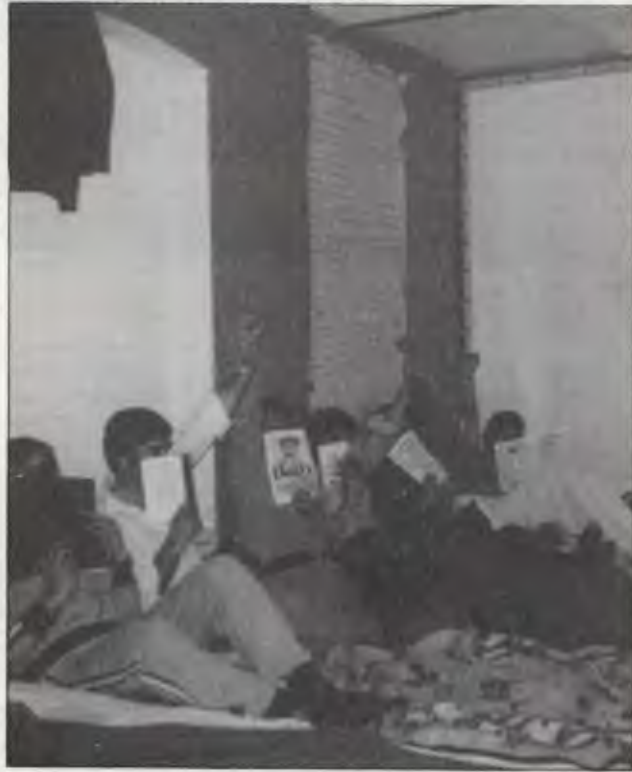
Hamburg'da İşçinin Sesi'nden açlık grevine katılan yoldaşlar, grevin 14. gününde.

BİRKOM adına yapılan konuşmada, cuntanın faşist yüzü, 500 bin kişiye doğrudan sergilendi. Böylece açlık grevi