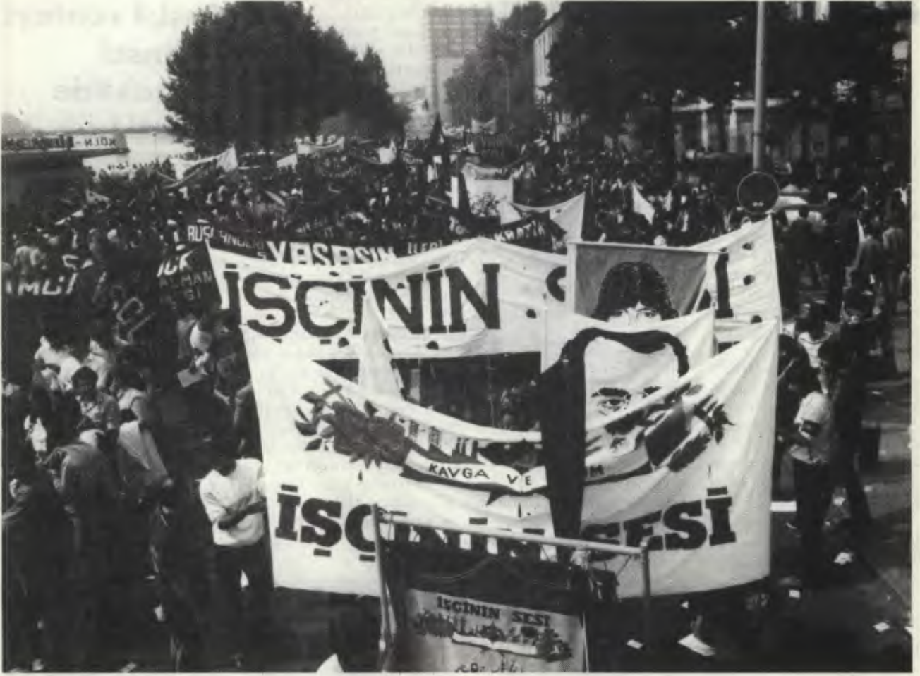
Frankfurt yürüyüşüne flamalarımız, kızıl bayraklarımız, devrimci belgelerimizle katıldık.

Onbinlerce ilerici, devrimci, demokrat faşist darbenin 2. yıldönümünde, onun artan korkularının daha da üstüne üstüne giderek büyük bir protesto yürüyüşü yaptılar. Böylece faşist diktatörlüğü tüm Avrupa kamuoyuna sergileme ödevlerini de yerine getirdiler.