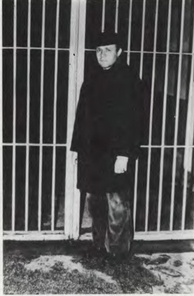
Dr. İsmail Beşikçi 1980 sonlarında Adapazarı cezaevinde.

1976'da yeniden Beşikçi'nin kitapları çıkmaya başlamıştır. 1977'de çıkan bir kitabında 1920'lerde ve 1930'larda Kürtlerin göçe zorlanışını anlatması, bundan sonraki bir başka kitabında okullarda okutulan tarih kitaplarında ırkçılık yapıldığını ileri sür-