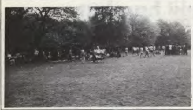
Folklor gösterisi sırasında