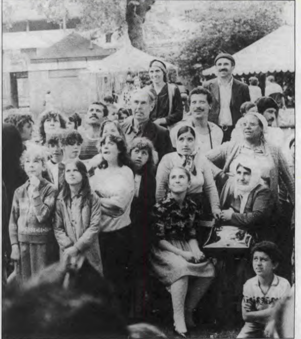
Londra İşçi Birliği'nin düzenlediği Dostluk Festivalini neşeyle izleyen Türkiyeli ve Kıbrıslı işçiler

Türkiye'de ölüm orucuna giden devrimcilerle dayanışmamızı yükselttik