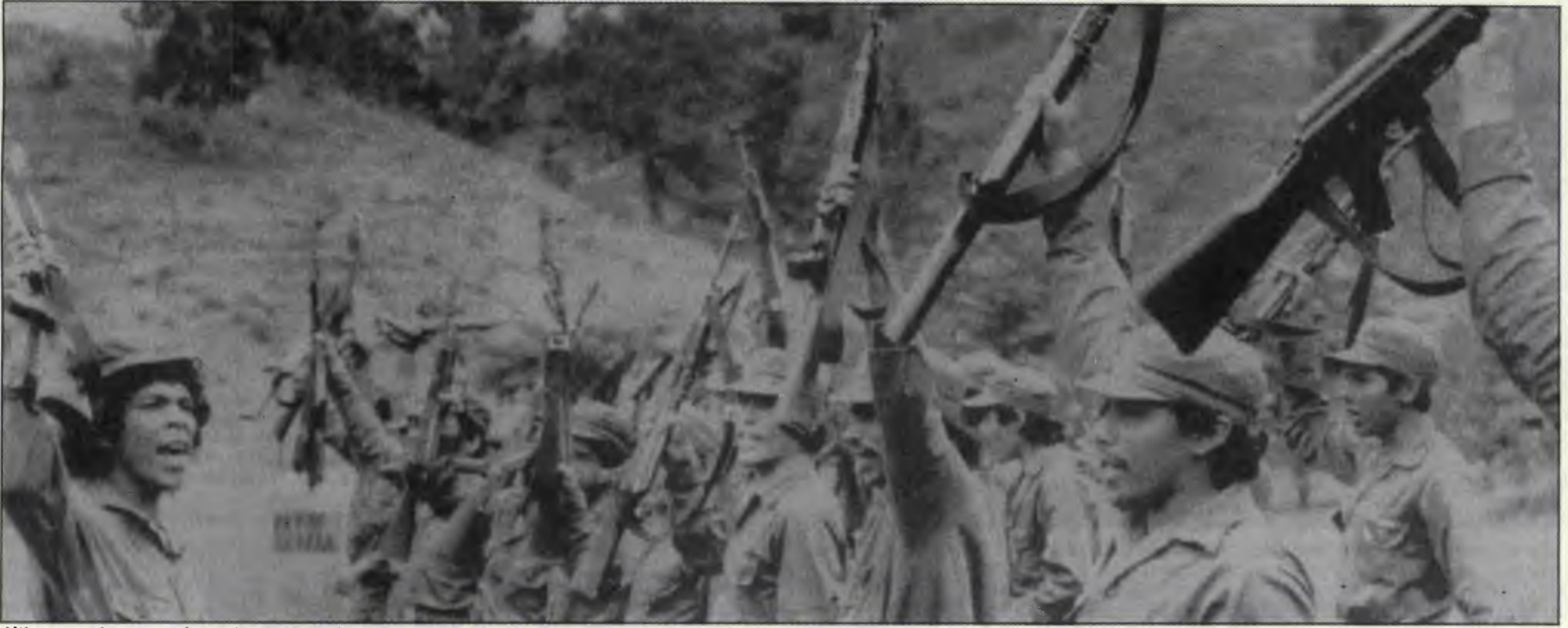
Nikaragua devriminin başarılarının kalıcılığı, zayıf halkalardaki kopmalara daha da ivme kazandıracaktır.

Nikaragua devrimi 5 yaşında! Uzun ve büyük özveriyle sürdürülen devrimci savaşım, Sandinistlerin öncülüğünde 19 Temmuz 1979 tarihinde başarıya ulaştı. Nikaragua devrimi, yalnızca Orta Amerika'da değil dünyanın çeşitli yörelerinde devrimci savaşımı güçlendirici, reformist düşleri yıkıcı bir etki yarattı.