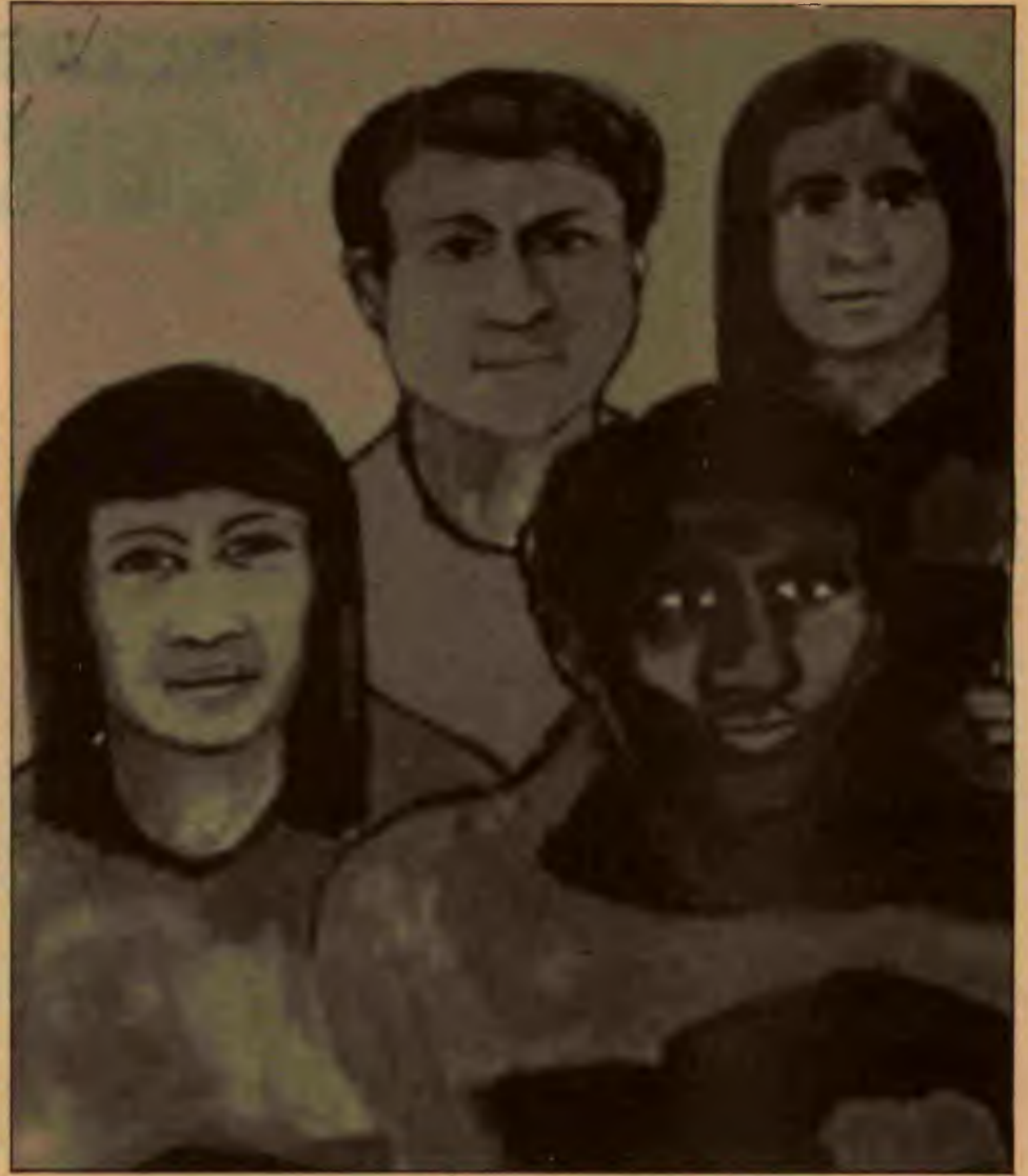
doğal devletidir." (Lenin, Toplu Yapıtlar , İng. basım, c.20, s.396)

"Bu yüzden tüm ulusal hareketlerin eğilimi modern kapitalizmin gereksinimlerini en iyi karşılayan ulusal devletlerin kuruluşu yönündedir. En derin ekonomik etkenler bu amaca doğru iter ve bu yüzden yalnızca Batı Avrupa'nın tümü için değil, tüm uygar dünya için ulusal devlet kapitalist dönemin tipik ve