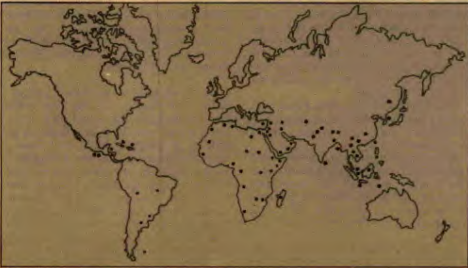
1945'ten günümüze kadar dünyadaki yerel savaşlar

"... İngiltere bir tarafsız(!) olarak geri planda kalırken, Avusturya ve Fransa, çarpışan taraflar, şimdilik İtalya'da 'yerelleşen' savaşa birbirlerini tüketecekler. Tarafsızlar birbirlerini felç ettiler ve savaşın da elleri bağlandı, çünkü onlar yumruklarını kullanmak zorundalar. Birinciler ve diğerleri arasında Prusya ... 'tamamıyla tarafsız ve özgür' yüzüp duruyor. Ortadaki adam her zaman aşırılardan daha kazançlı çıkıyor... Fransa Prusya'nın Avusturya adına arabuluculuk yapıp yapmadığını, Avusturya ise