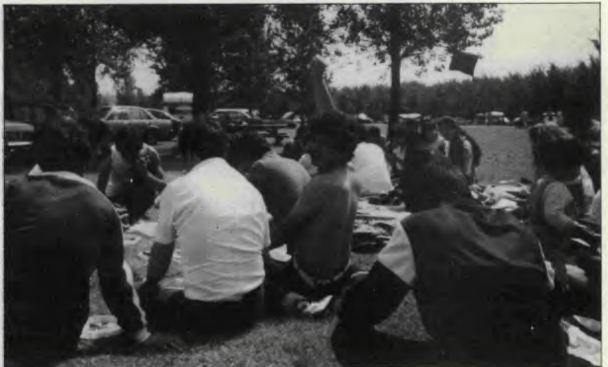
Kızıl bayrak ağacın dalları arasında dalgalanıyor