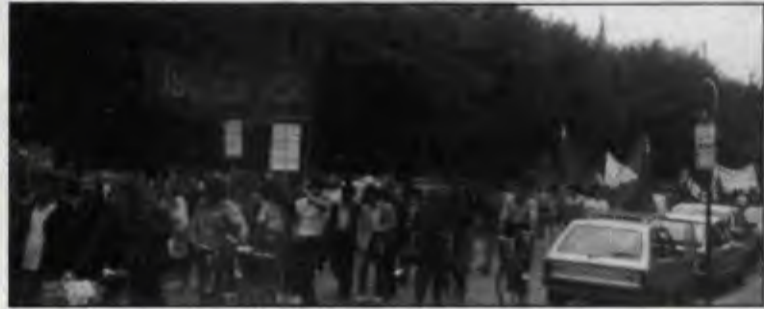
İşçinin Sesi, Nikaragualı devrimcilerle dayanışmayı yükseltti