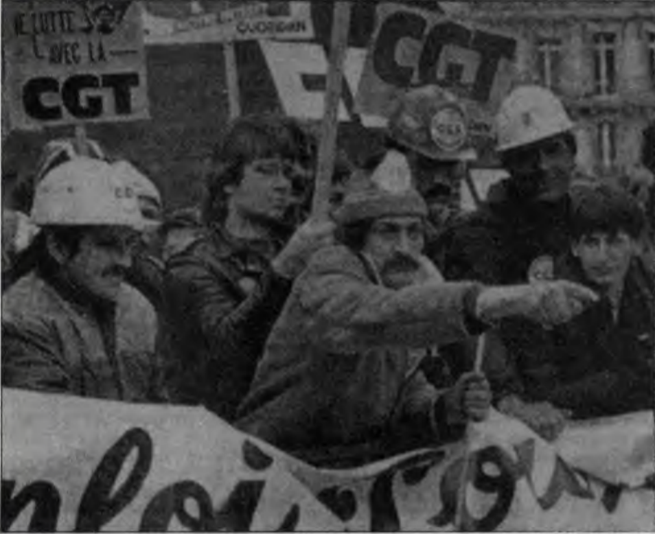
Fransız proletaryası sosyalistlerin işçi düşmanı politikasına karşı protestosunu yükseltiyor

Uzun bir süredir Fransa'dan duyageldiğimiz günahlara FKP artık en azından hükümet düzeyinde ortak değil!