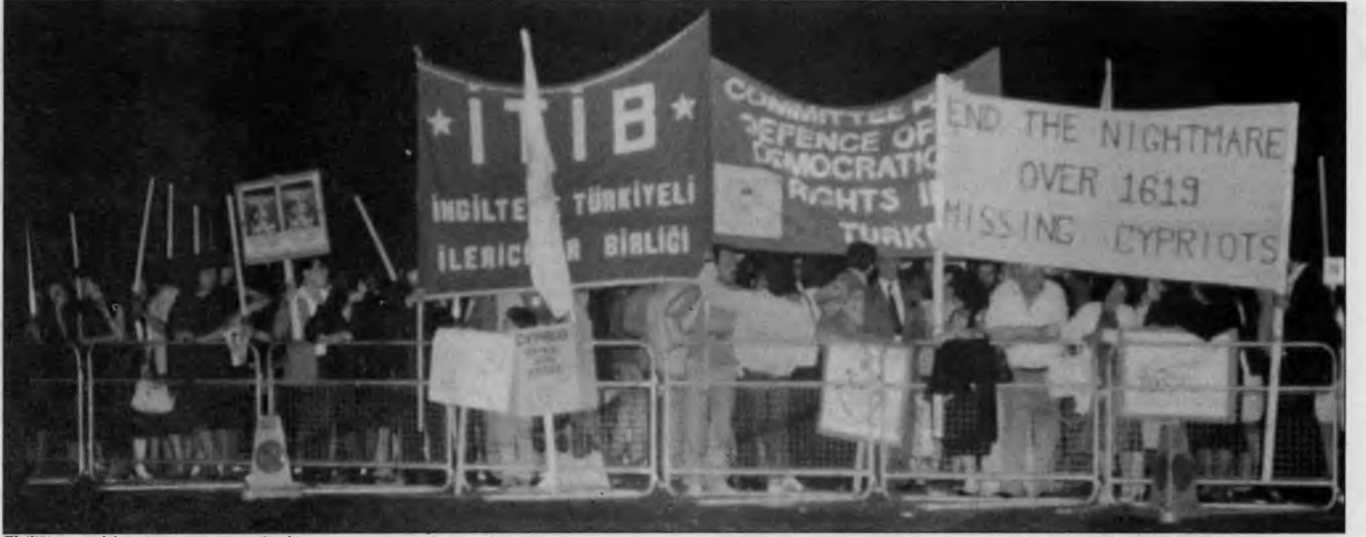
Elçiliğin önündeki protesto gösterisinden bir görüntü

Proletarya enternasyonalizminin ne büyük etkileme gücüne sahip olduğu gösteride yansıdı.