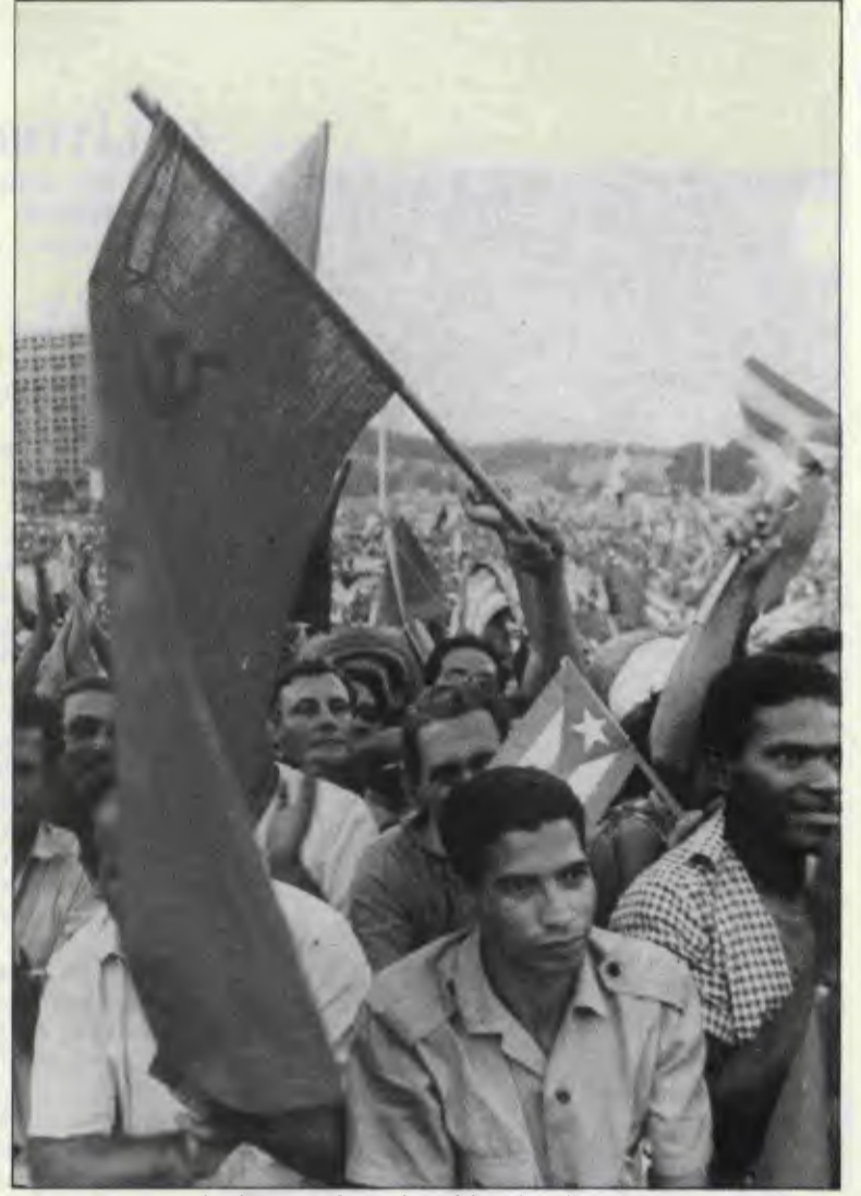
Küba ABD'nin arka bahçesinde civil civil kızılığıyla partiyor