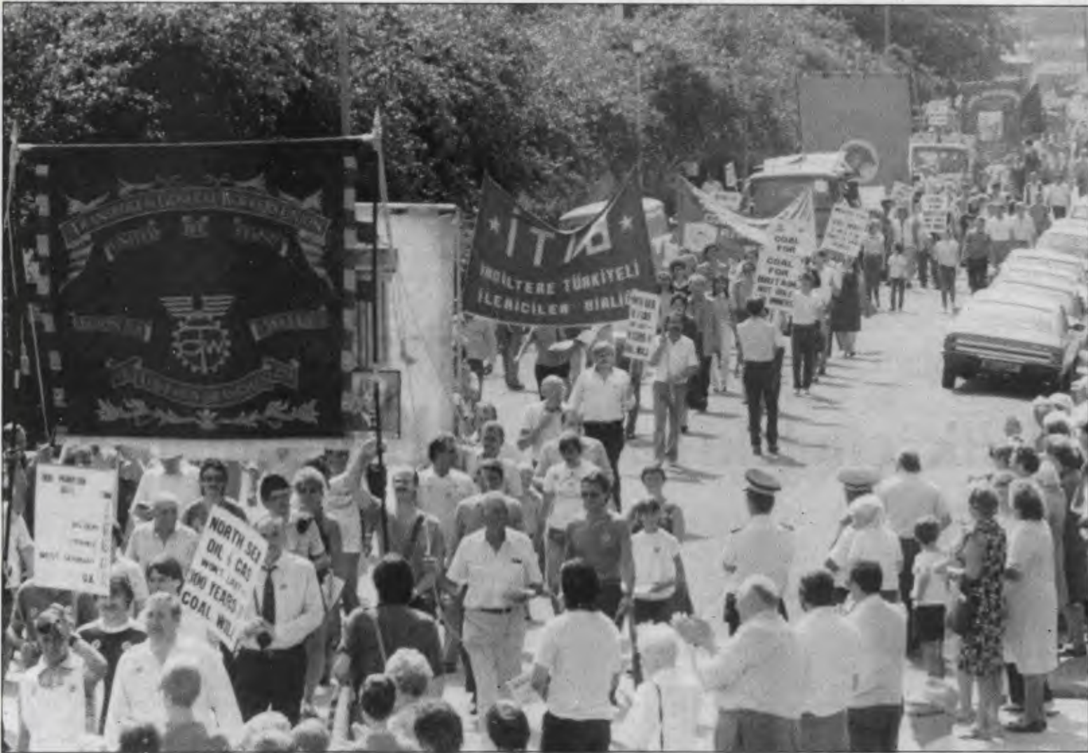
Maden işçileri Türkiyeliler ile birleşen, komünistlerin savaşına destek olmak için yürüyüşe katıldığını öğrenince yüzleri ışıltıyor. Maden suyu getiriyorlar, gelip sarılanı, yanımızda yürüyen var.