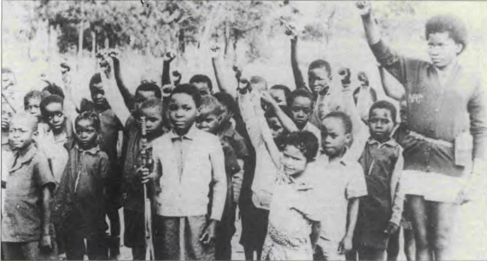
Güney Afrika, zenci çocuklar için bir yanda düzende yerlerini benimsetici resmi beyin yıkama eğitiminin, öte yanda, bu düzene karşı silahlı savaş eğitiminin olduğu keskin çelişkiler yumağıdır

Görünen o ki, bu partiler verdikleri sözleri tutsalar da tutmasalar da (ırk ayrımcılığı rejiminin bütün amacı, bu seçimler yoluyla "renkli" ve "Hintli" parlamento liderlerini satın almaktır), düzenlenen seçimler rejime güvenli bir tampon mekanizma yaratmak yerine, sisteme karşı verilen savaşıma yeni boyutlar getiriyor.