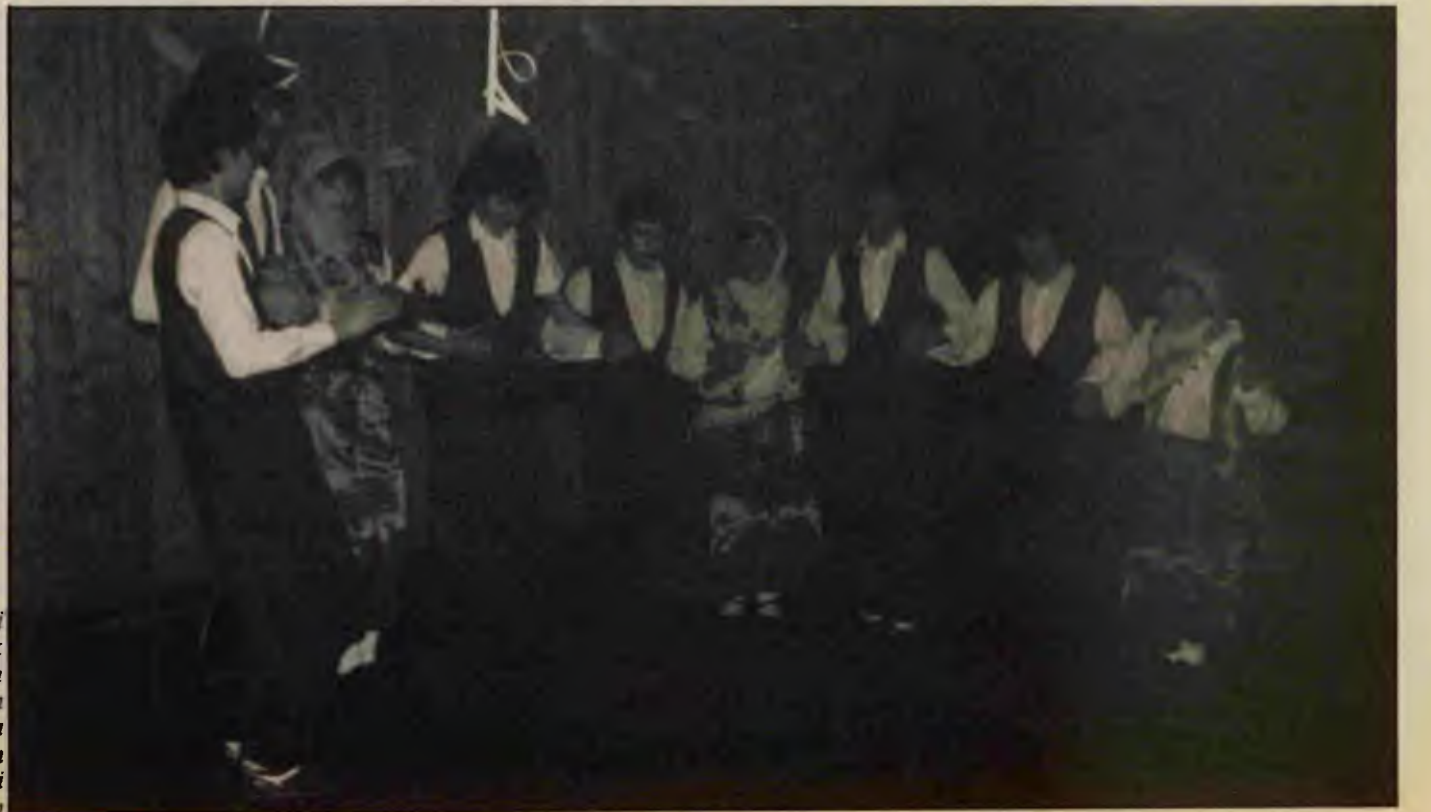
Rotterdam'daki Gençlik Merkezi'nin yeni kurulan halk oyunları ekibinin gecedeki gösterisinden