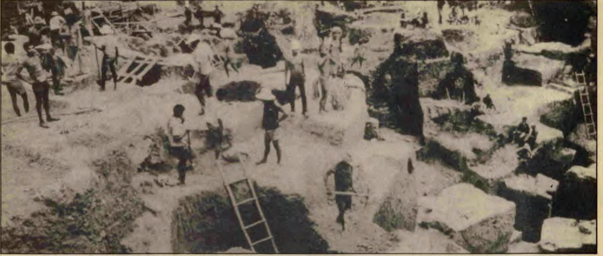
Brezilya nasıl Batı'nın 8. büyük gücü oldu? Örneğin resimde görüldüğü gibi işçileri altın madenlerinde, kazma kürekle, 10-12 saat, ölüm tehlikesi içinde çalıştırarak.

Brezilya'da 21 yıldır ilk kez sivil bir cumhurbaşkanı "seçildi". 131 milyon nüfusu ve Avrupa'dan büyük alanı olan dev Brezilya'da, 15 Ocak'ta yapılan bu iki dereceli "seçimlerde", yalnızca 686 temsilci oy kullandı.