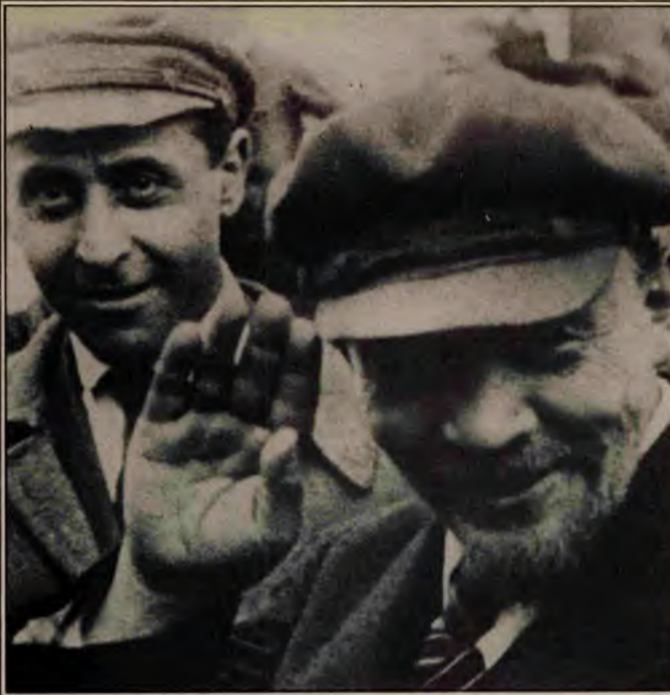
Lenin Bolşevizm için şöyle diyordu:

I. Blok, tutuklular ve cezalı hükümlüler bölümü, yaklaşık 100 kişinin bulunduğu bir yerdi. Kapılar sürekli kapalıydı ve katlar arasında ilişkiler minimumda tutuluyordu. Senin yanındaki hücrenin adamıyla görüşebilmek için bile, yemeğin dağıtılması sırasında kapının açıldığı 1-2 dakikalık süre içinde, göbeğin çatlıyordu. Tek kişilik hücrede isen bunun ne ağır bir psikolojik baskı yarattığını anlatmaya gerek yok. Hele bir de