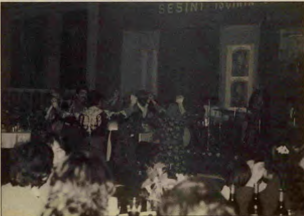
LİB Folklor Ekibi salonu coşturdu.