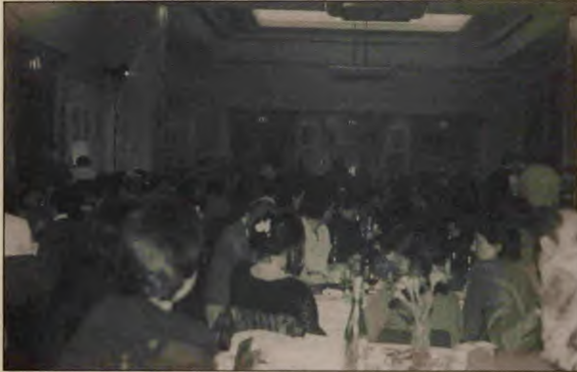
Kapanış gecesi, bugüne kadar yaşadıklarımızın en yığinsalı oldu.

Programda, Yalçın Çağlar yoldaşın konuşmasından sonra İşçinin Sesi Korosu'nun programına geçileceği belirtiliyordu. Ancak salonu dolduran yoldaşlarımız Yalçın Çağlar yoldaşın konuşmasını alkışlarken, "yoldaş, Yürükoğlu yoldaş" diye tempo tutmaya başladılar. Yürükoğlu yoldaş coşkunun alkışları arasında mikrofona geldi ve şöyle dedi: