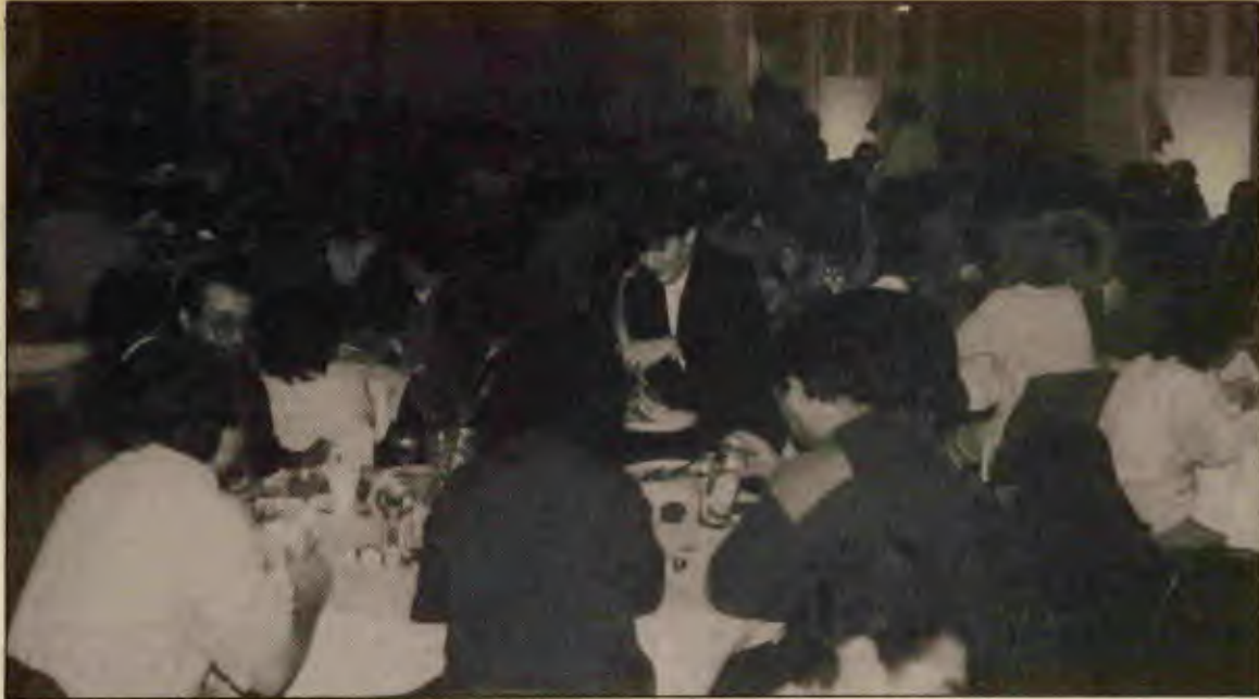
Gecede verilen güzel yemek "patates" esprileri arasında yendi.

"Bu yıl 9. kez tamamladığımız taarruzlar bize, örgütümüze çok şey kattı. Bunlar içinde en önemlisi yoldaşlar, kendine ve sınıfına güven duygusudur. 'Bizim yerimize düşünürler, bizim yerimize bilirler'. Taarruzlar bu görüşleri yerle bir eden, kendimize olan güvenimizi, sınıfımıza olan güvenimizi bize veren önemli bir olaydır. Hele ki, düşünürseniz, doğduğumuz andan itibaren okullarda öğretmenler, komşular, ahbablar, hep 'senden daha iyi bilirler' diye beynimize işlerler. Patronlar, patron kafasına sahip olanlar sürekli olarak işçilere 'senden daha iyi düşünenler vardır' diye telkin ederler. Ama öyle değil. Bizim sorunlarımızı bizden daha iyi düşünenler yoktur. Hele ki Türkiye insanının, Türkiye emekçisinin, Türkiye devriminin sorunlarını bizden başka, bizim kadar içten düşünen yoktur. Biz kendimize ve kendi sınıfımıza güveneceğiz. Ve bu hareketi ve bu ülkeyi ve bu insanları hiçbir devletin dış politikasına da alet ettirmeyeceğiz. Taarruzlar bize