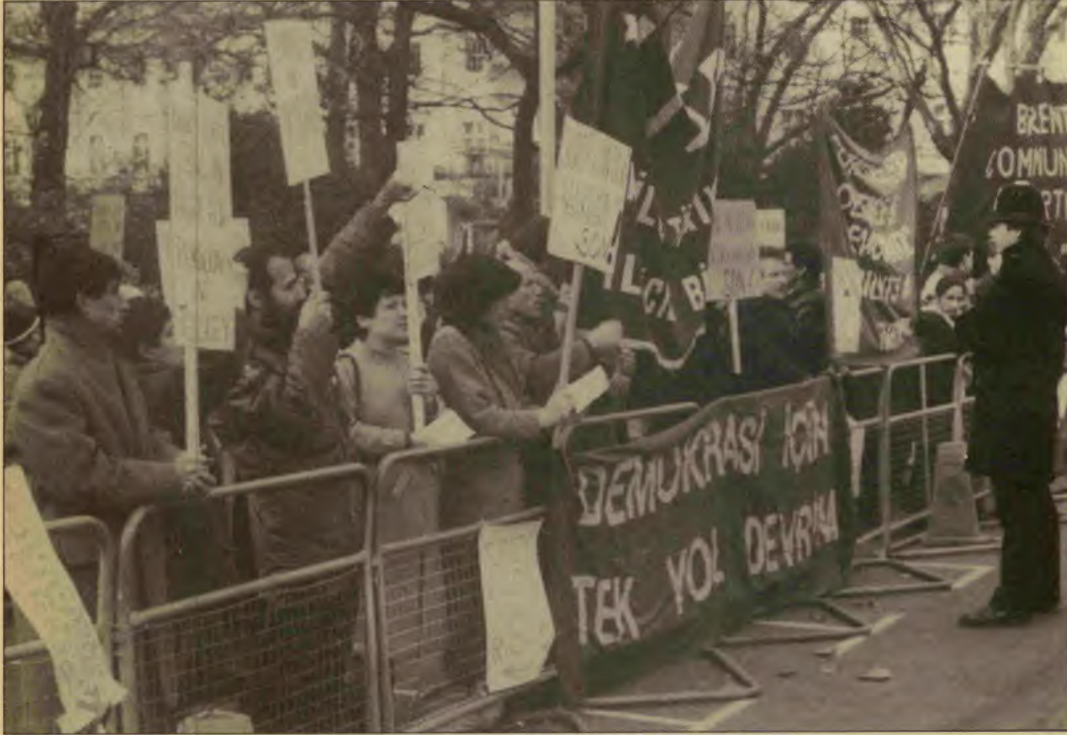
Özal'ı protesto edenler coşkuyla sloganlarını haykırdılar.

Basın, radyo ve televizyon eylemlere kayıtsız kalamadı. Özal'la ilgili her haberde protesto eylemleri de yer aldı. Gizli görüşmelerde kimin ne kazandığını bilemeyiz ama açık gözlemlerde Özal kaybetti.