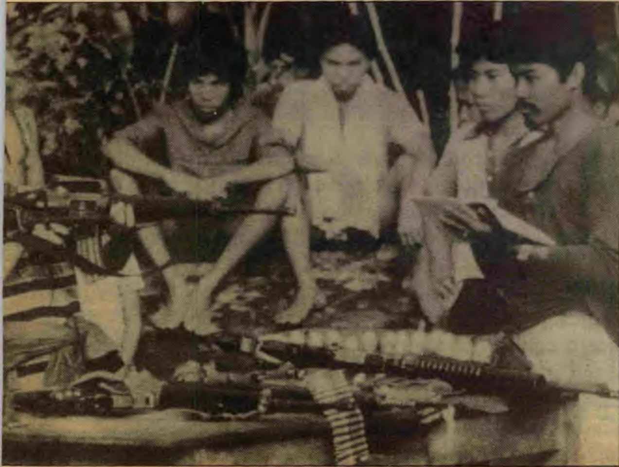
Halkın savaşımına öncülük eden Yeni Halk Ordusu militanları askeri eğitim görürken