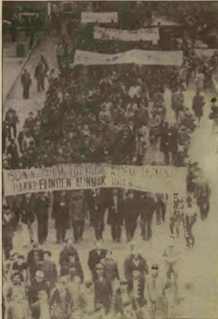
İlk yürüyüş kutlu olsun, nice yürüyüşlere.

Yürüyüşün sonunda 4 sendikacı konuşma yaptılar. Türk-İş temsilcisi Demiralp, işçi haklarının geri alınmasına, hayat pahalılığına değindi ve Anayasa'nın, iş yasalarının değiştirilmesini istedi. Türk-İş Teşkilatlanma Sekreteri Balaban yine, Türk-İş yönetiminin toplumsal düzeni koruma endişesini dile getirdi ve patlama olmaması için birşeyler yapılması gerektiğini söyledi. Teksif Genel Sekreteri Polat ise Balıkesir Pamuklu Dokuma Fabrikası'nda 400 işçinin 5 aydır ücret alamadığından söz etti. Ayrıca bir de yine Teksif'ten Akyüz konuşma yaptı. Yürüyüşün adı, "hükümete