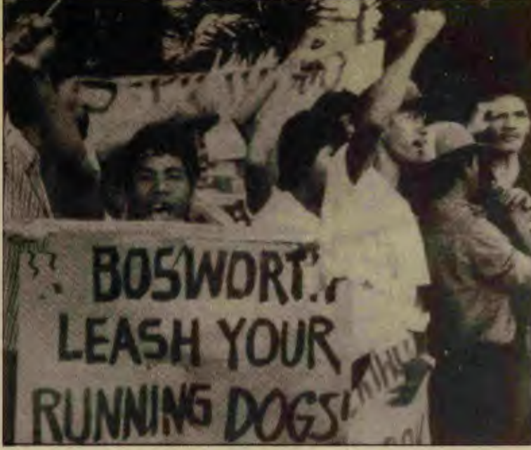
ABD'ye karşı protestolar yaygınlaşıyor.

The Economist, anti-Marcos kampanyasının anti-Amerikan bir kampanyaya dönüşmemesi için ABD'nin iki potansiyel bağlaştığı olduğunu söylüyor: