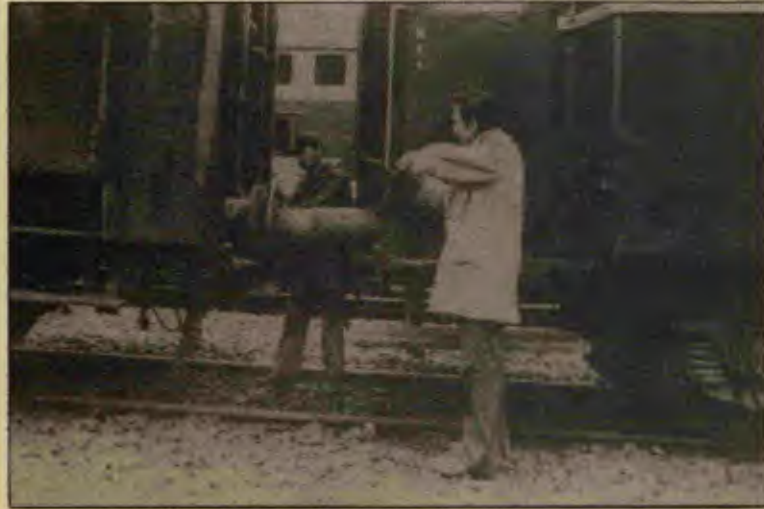
DDY'de işçiler günde en az 11-12 saat çalışmaya zorlanıyor.

"Memur" işçiler, tüm bu tutumların DDY'nin kanunlar-