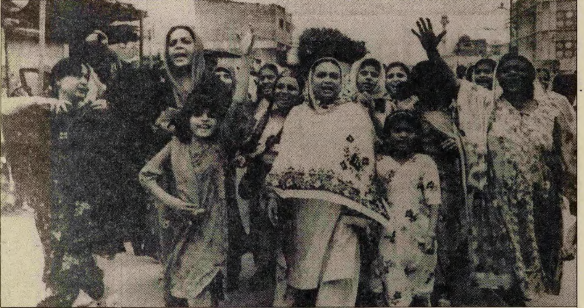
Pakistan'da kadınlar Şeriat kanunlarına karşı seslerini yükseltiyorlar.

“Güdümlü demokrasi” planı yalnızca burjuva partilerinin liderleri ile sınırlı olsa, “işler iyi gidiyor” demek olasıdır. Kapitalist düzeni korumak için sınıf güdüsüyle bile, burjuvazi kendi içinde kavga dövüşle anlaşıyor. “Güdümlü demokrasi” planına en büyük tehlike, ezilen ve sömürülen halktan geliyor. Son aylardaki olayların içinde Pakistan halkı, burjuva muhalefeti tanıyor, kendi gücünün farkına varıyor.