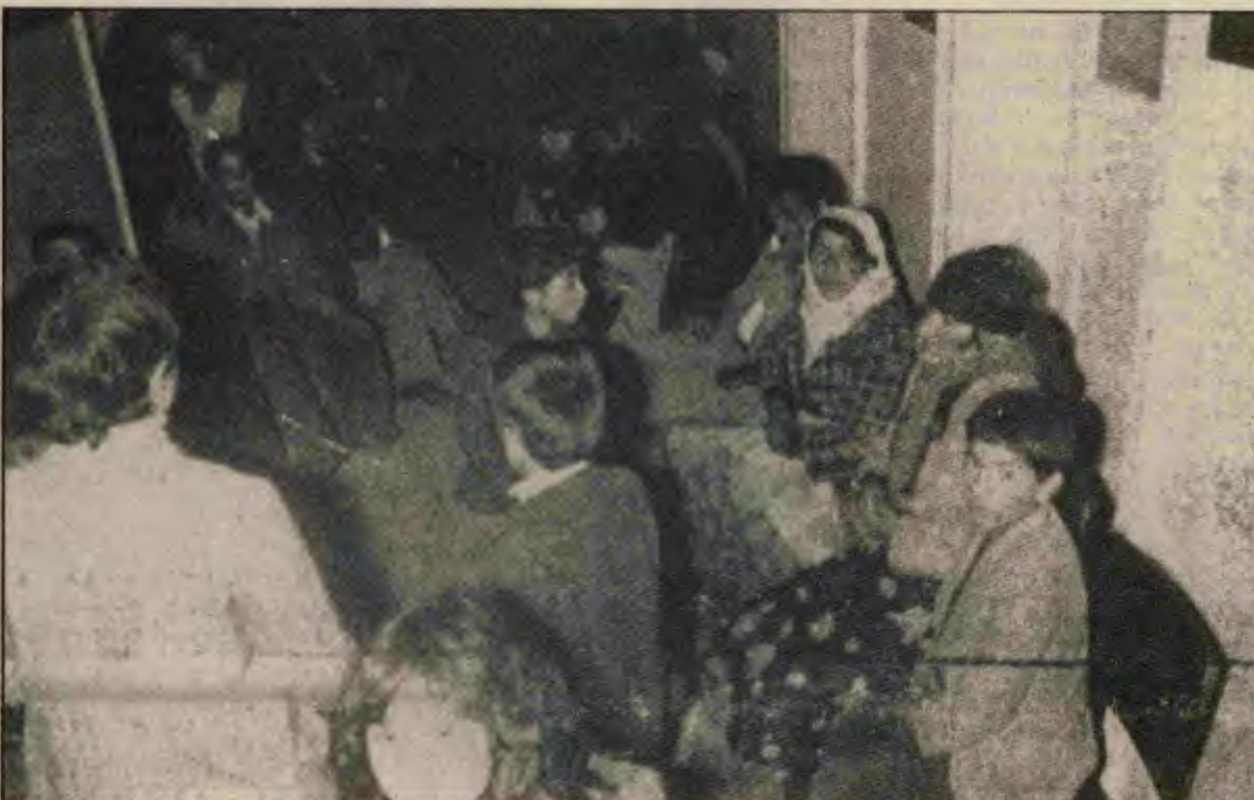
Halkımız böyle daha ne kadar hastahane kuyruklarında sürünecek.

Onlar "anarşi şu kadar can aldı" diye halkımıza faşizmi