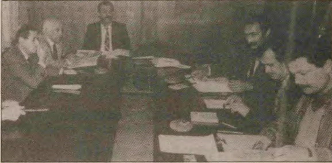
Otomobil-İş yöneticileri, işverenle toplu sözleşme masasında

Otomobil-İş Genel Kurulu'nda, Türk-İş'te sendikal birliğin önemini vurgulayan, 35 saatlik çalışma haftası, net 200 bin TL asgari ücret gerektiğini belirten delegeler oldu.