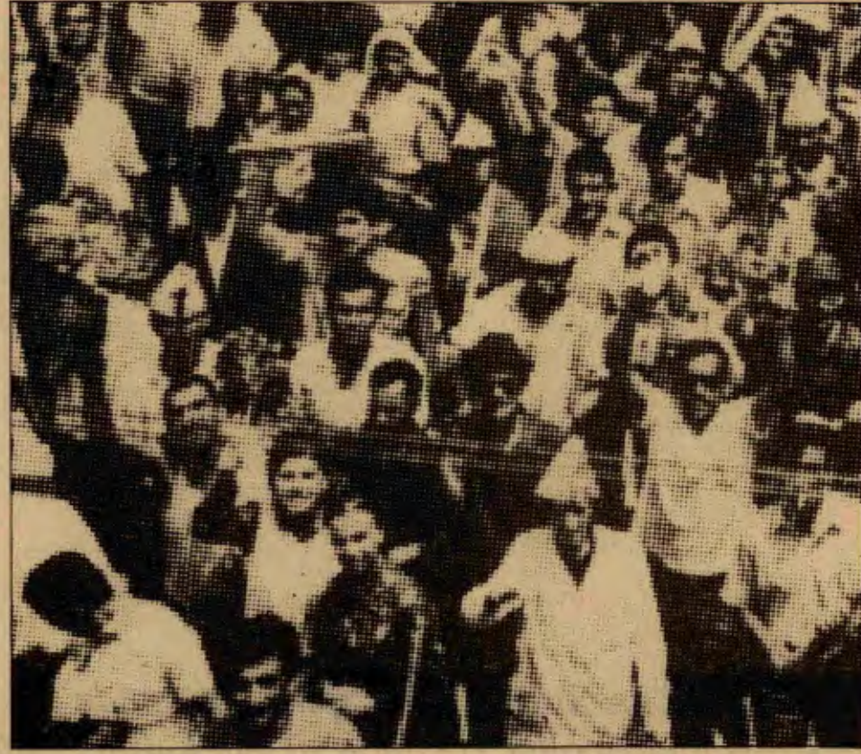
Sesi Program , s.23)

olan 'emperyalistleşerek sorunları çözme' isteği gerçekleşse de ülkeyi bir alt emperyalist ülke olarak yeni ve karmaşık çelişkiler içine sokacak bir istektir. Türkiye finans-kapitali varlığını sürdürmek için asıl olarak ülke içinde sömürüyü aşırı yoğunlaştırmak, bu arada iyice keskinleşen sınıf çelişkilerini de 'bastırmak' zorundadır." (TKP—İşçinin