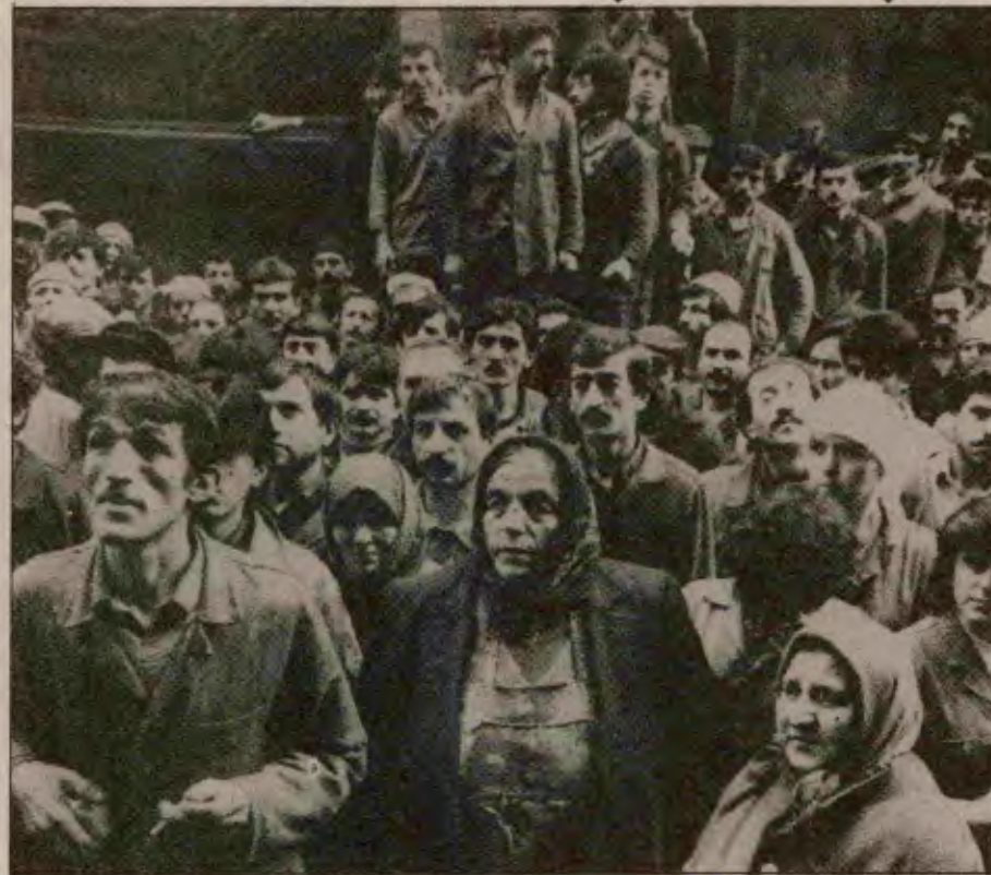
Kazlıçeşme'de Abdinur Alkoş deri fabrikasında bir işçinin "iş kazasında" ölmesi üzerine 130 fabrikanın 3 bin işçisi bu iş cinayetini protesto etti.

— Gencecik işçiyi hiçbir eğitim vermeden böyle bir makine-