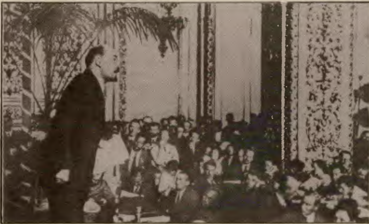
Komünist Enternasyonal'in III. Kongresi'nden

İşte bugünkü Komünist Enternasyonal bu devrimci hareketler eliyle kurulma şansına sahiptir. Bu partiler ve hareketler Üçüncü Kongre'nin benimsediği bütün ülkelerin işçilerinin kapitalizme karşı birliğini kurabilir. Komünistler Lenin'in gösterdiği yoldan ilerleyebilir. Dünya devrimci süreci komünistlerden yana ilerliyor. Proletaryanın enternasyonalist bayrağı tekrar dalgalanacaktır. Üçüncü Kongre'nin başlattığı görevler sürdürülecektir.