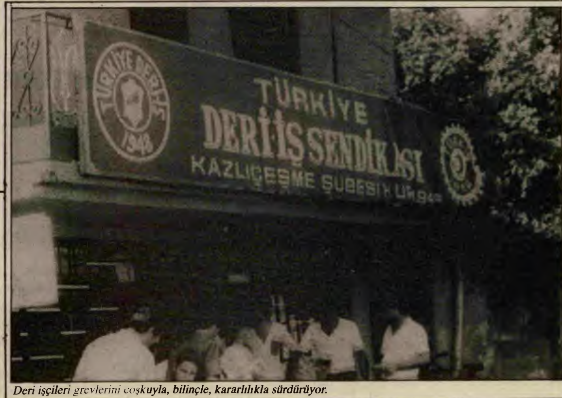
Deri işçileri grevlerini coşkuyla, bilinçle, kararlılıkla sürdürüyor.

Evet, bu nedenle de işçi sınıfımız yönetimi almalıdır. Artık tüm emekçi yığınların umudu işçi sınıfımızdır.