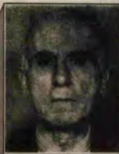
Şefik Hüsnü Değner