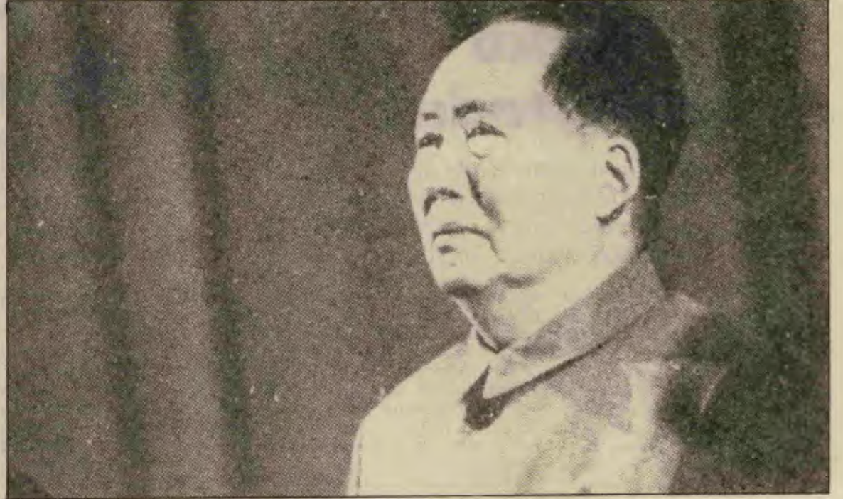
Mao Zedung çağımızın büyük bir devrimcisi ve komünisti idi.

Devrimi başardıktan sonra da az gelişmiş bir ülkede sosyalizm kurmanın önündeki tuzakları belki de herkesten iyi gördü. Ama