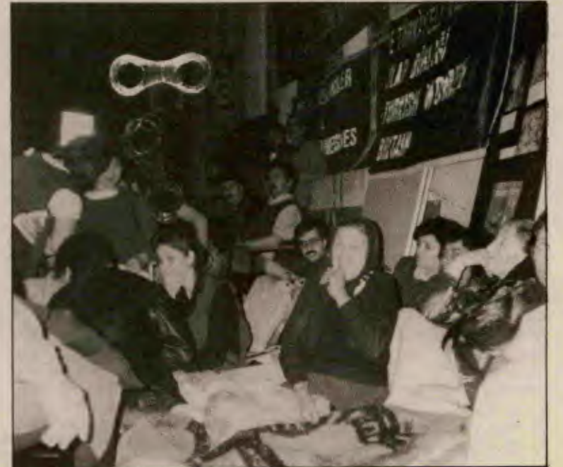
Devrimci tutukluların yakınları da Londra'da açlık grevindeydiler.

28 Ağustos Cuma günü öğleyin saat 12.00'de başlayan açlık grevi eylemi başından sonuna