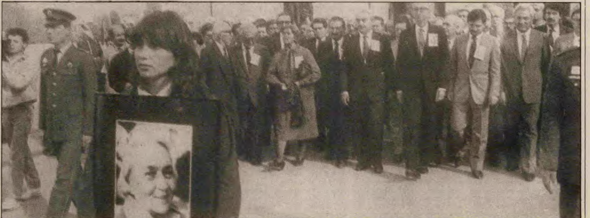
Behice Boran bütün zaaflarıyla birlikte Türkiye devrimci hareketi içinde yer almıştır. Onun cenazesinin Türk bayrağına sarılı olarak, meclisin önünden kaldırılması zuldür.

Behice Boran, tabutunu sardıkları Türk bayrağının, önünde tören yaptıkları meclisin sahibi burjuvazinin malı değildir. Kocaman yanlışlarıyla da olsa, o, işçi hareketinin, devrimci hareketin tarihinde bir yapaktır. Öyle kalacaktır.