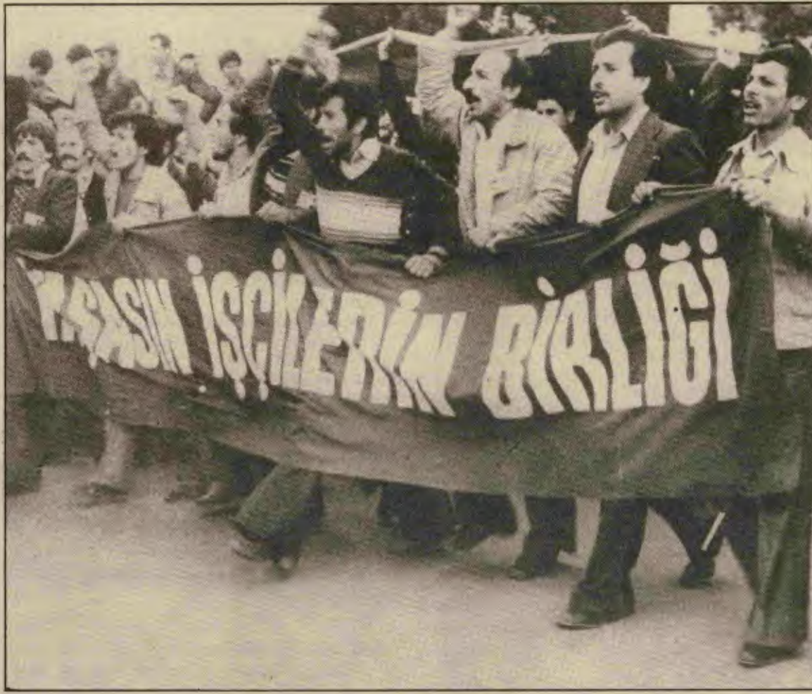
İşçiler demokrasi savaşımını yükseltiyor, Türk-İş'te birlik istiyor.

Enerji işkolunda ezici çoğunluğa Türk-İş üyesi Tes-İş sahiptir. Üye sayısı yüzünü aşıyor görünen Tes-İş'in dışında bir de barajı