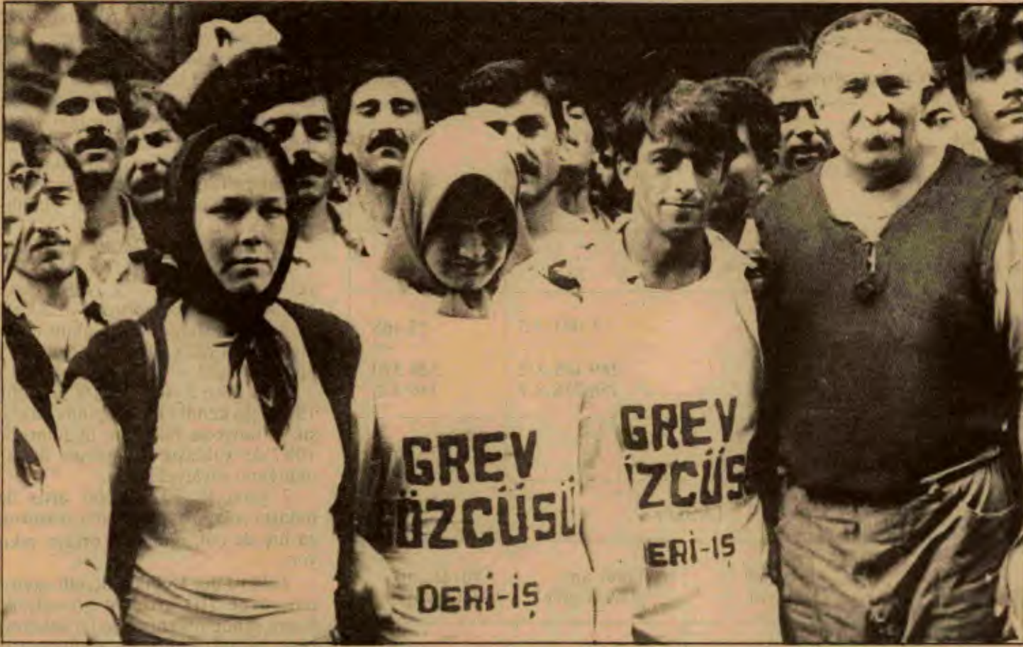
Türkiye işçi sınıfı, aileleriyle birlikte nüfusun yarısına yaklaşan, en azından 25 milyonluk bir yığındır. Türkiye bir işçi denizidir.

İşsizlerin sayısı 1 milyon 76 bindi. Bu sayı bugün yaklaşık 1 buçuk milyondur. 1985'te işçi emeklilerinin, yani Sosyal Sigortalar emeklilerinin sayısı 628 392 idi. Bu sayı da bugün yaklaşık 800 bindir.