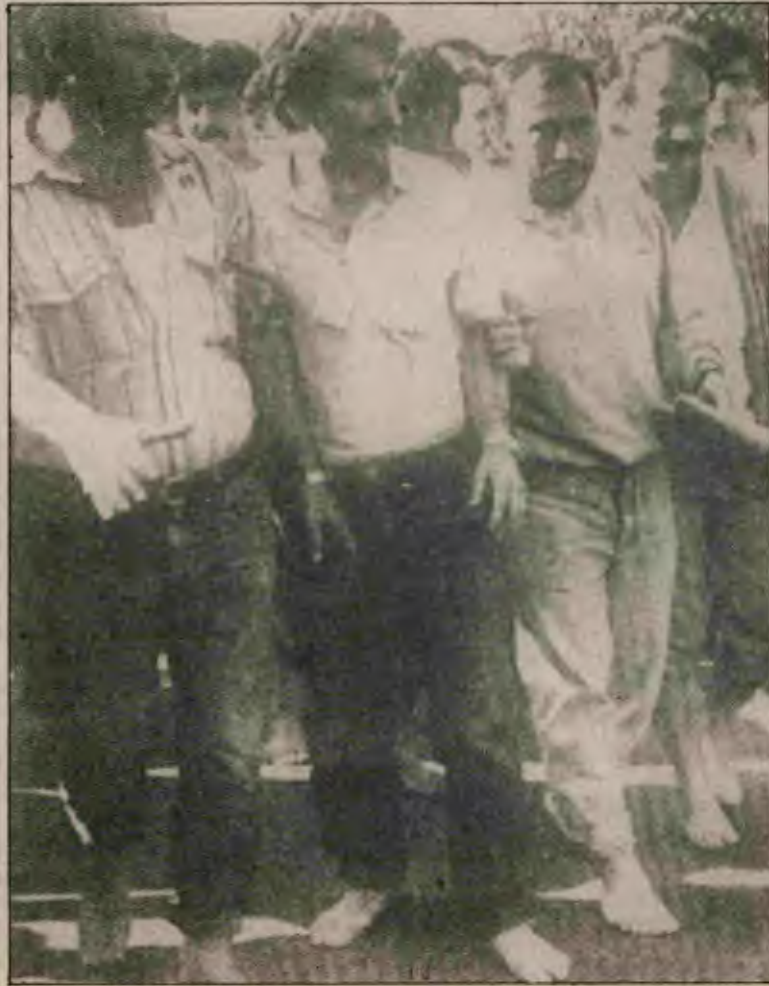
Sorun artık ne %58 ne %158 sorunu değil, toplu hesaplama.

Kamu İşveren Sendikaları yetkililerinin, "İmren hanım"ın, hükümetin Türk-İş yönetimiyle düzenlediği zirvelerin, buralarda alınan kararların kaderi, buza yazılan yazıya benzedi. Hükümetin bütün bu çabaları sonucunda, kamu kesimindeki işçilerin 1988 yılı toplu sözleşme zammının "%58" olarak belirlendiği açıktandı. İşçiler, "biz böylesine bir düzeyi tanımıyoruz"