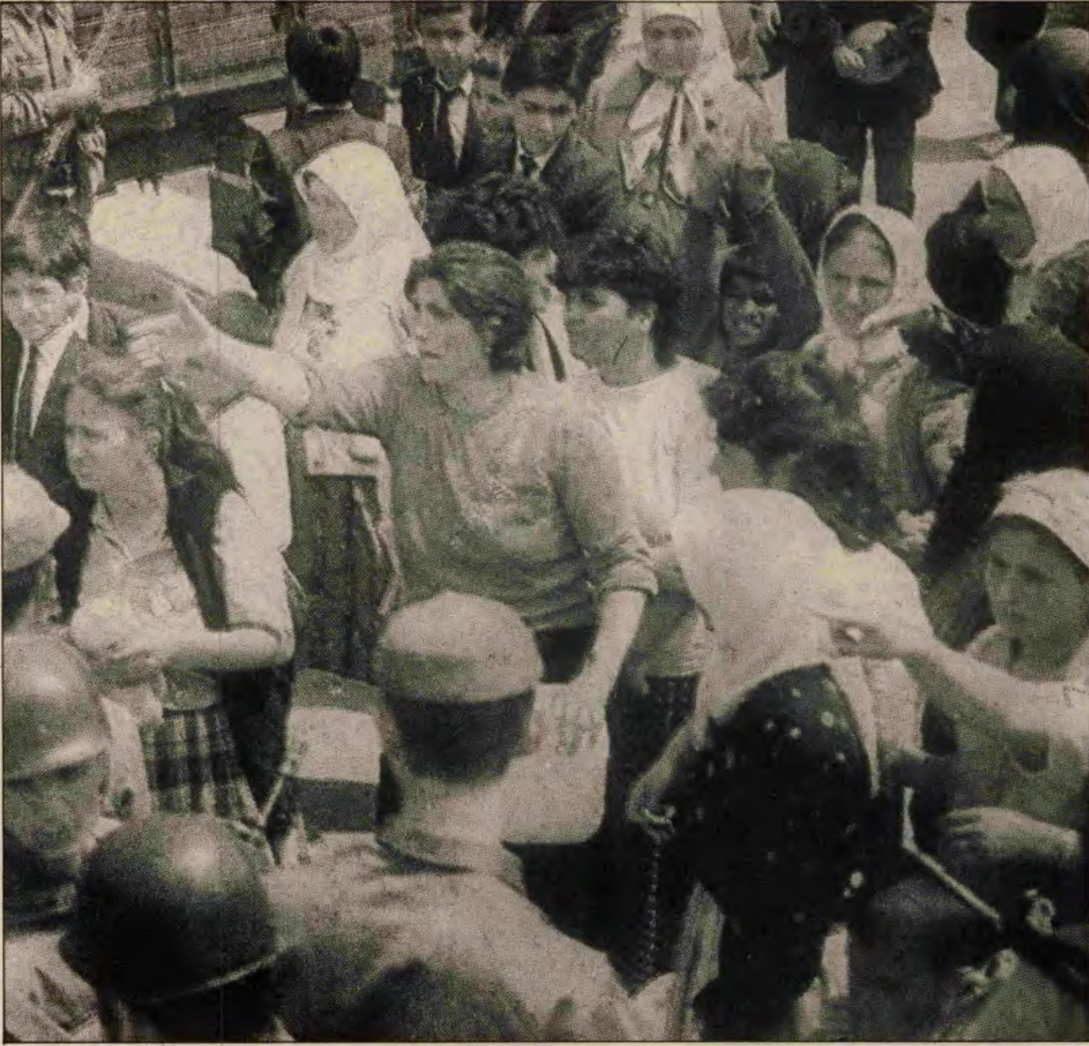
15-16 Haziran'ın yıldönümüne rast gelen şu günlerde, emekçi halk, savaşımı militanlaştırıp yığınsallaştıran işçi sınıfının ardından sokaklara döküldü, burjuvazinin askerine, polisine meydan okuyor. "Karakolluk günler" gündemdedir.