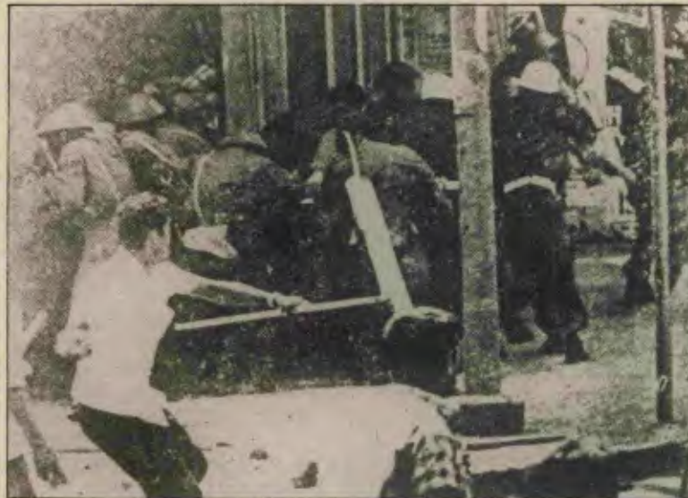
Hak almanın yolu 15-16 Haziranlardan geçiyor.

"İşçi ordu elele" belgisiyle yola çıkan işçiler, eylemin içinde kısa sürede bu belginin yanlışlığını anladılar. Burjuvazinin ordusu, polisi, tanklarıyla, süngüleriyle işçilerin üzerine saldırdı. Bunu gören işçiler burjuvazinin ordusuna, tanklarına, süngülerine taş ve sopalarla karşılık verdiler. Burjuvazinin ordusunu, polisini geri püskürttüler. Burjuvazinin