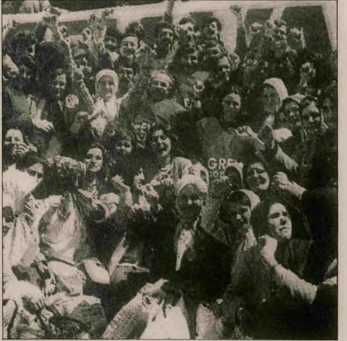
İşçilerin yığınsal, militan eylemleri, burjuvazinin grev yasağını daha doğar doğmaz kadük etti.

"Batı'daki işçilerin elde ettikleri haklara Türkiye'deki işçiler layık görülmemiştir. Bu değişikliklerle Tür-