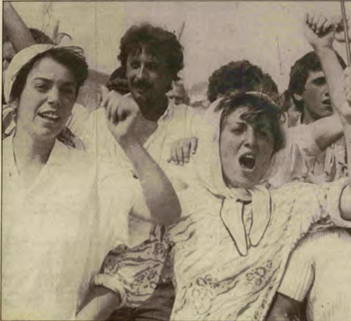
En son gecekondu eylemleri, yıkımlara karşı en iyi yolun militan eylem olduğunu gösterdi.