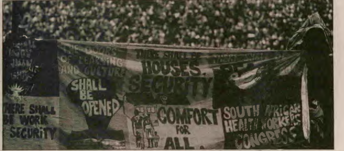
Yapılan en son ANC gösterisi düzenin kabul edebileceği, uzlaşmacı belgilerin sergilendiği bir platform oldu.

ortamında reformların ne gibi etki yapacağı belli olmaz. Reformlar devrimci mücadelenin daha rahat yürütülmesine de yarayabilir. Bu nedenle ANC'ye deniyor ki, sen önce devrim kaçını bir temelde daha geniş bir birlik sağla, biz ödümleri öyle verelim. Tabii o zaman hepsi de verilmeyebilir.