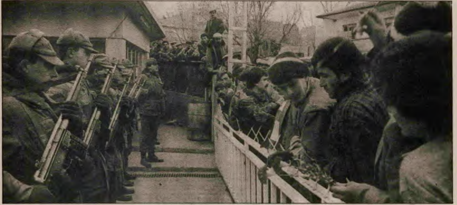
İşçiler, yaşama hakkını bilek gücüyle koparmalı ve bu katil düzen, bekçileriyle birlikte yıkılmalıdır.

Biliyoruz, temel yasası kâr olan kapitalizm işçi sağlığı ve iş