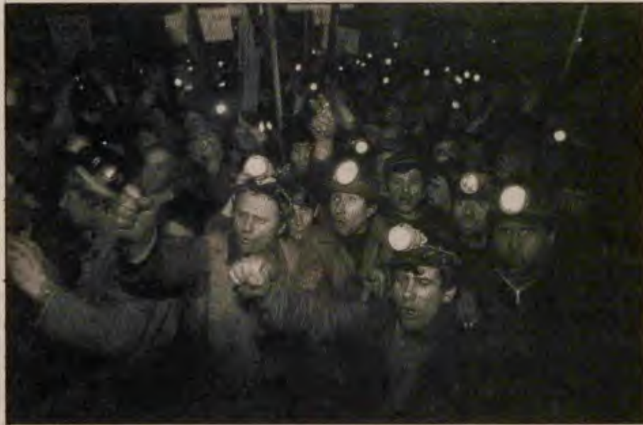
Karşı-devrim işçi sınıfını siyasal erkten uzaklaştırdı ama, işçiler kapitalistlerin 43 yıl sonra yeniden geri gelişlerini protesto ediyor, karşı devrimcileri sokaklarda, sopayla dağıtıyorlar.