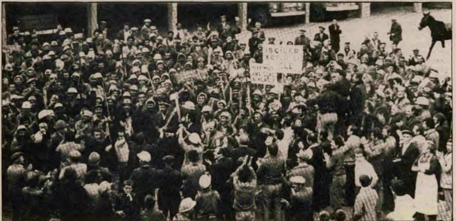
Yeniçelttek işçileri 1970'ler boyunca şanlı, militan kavgalar verdiler. Bu resim 1976 grevi sırasında çekilmişti.