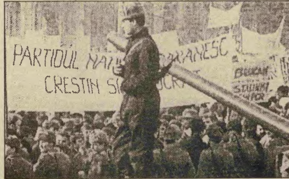
Gorbaçofçular ise, kendî yaratımları olan ve işbirliği yapmak istedikleri (resimdeki) Batıcı karşı-devrimcilerle işçi sınıfı arasında sıkışıp kaldılar.

"Çavuşesku diktatörlüğü tarafından ele geçirilmiş ve ulusal ruha ve tarihsel geleneklerimize ters düşen bir uygulama içinde olan RKP, 12 Ocak 1990 tarihinden itibaren yasaklanmıştır." (Financial Times, 13 Ocak 1990)