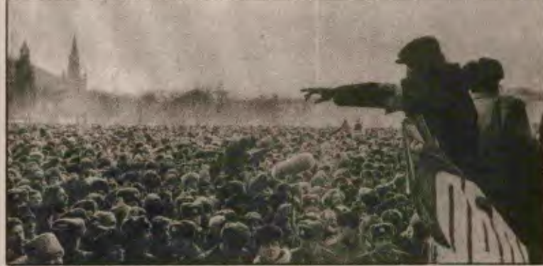
Sovyet işçi sınıfı, aktif yığın de mokrasisine ve gerçek bir komünist partisine hiçbir zaman bu denli gereksinim duymamıştı.

Başbakan yardımcısı ve ekonomik reform programının sorumlusu Abalkin, Yüce Sovyet'e özel mülkiyeti yasalaştıran bir tasarı sundu. Abalkin, "Sovyet halkının olumsuz(!) tutumu" yüzünden, tasarıda "özel mülkiyet"