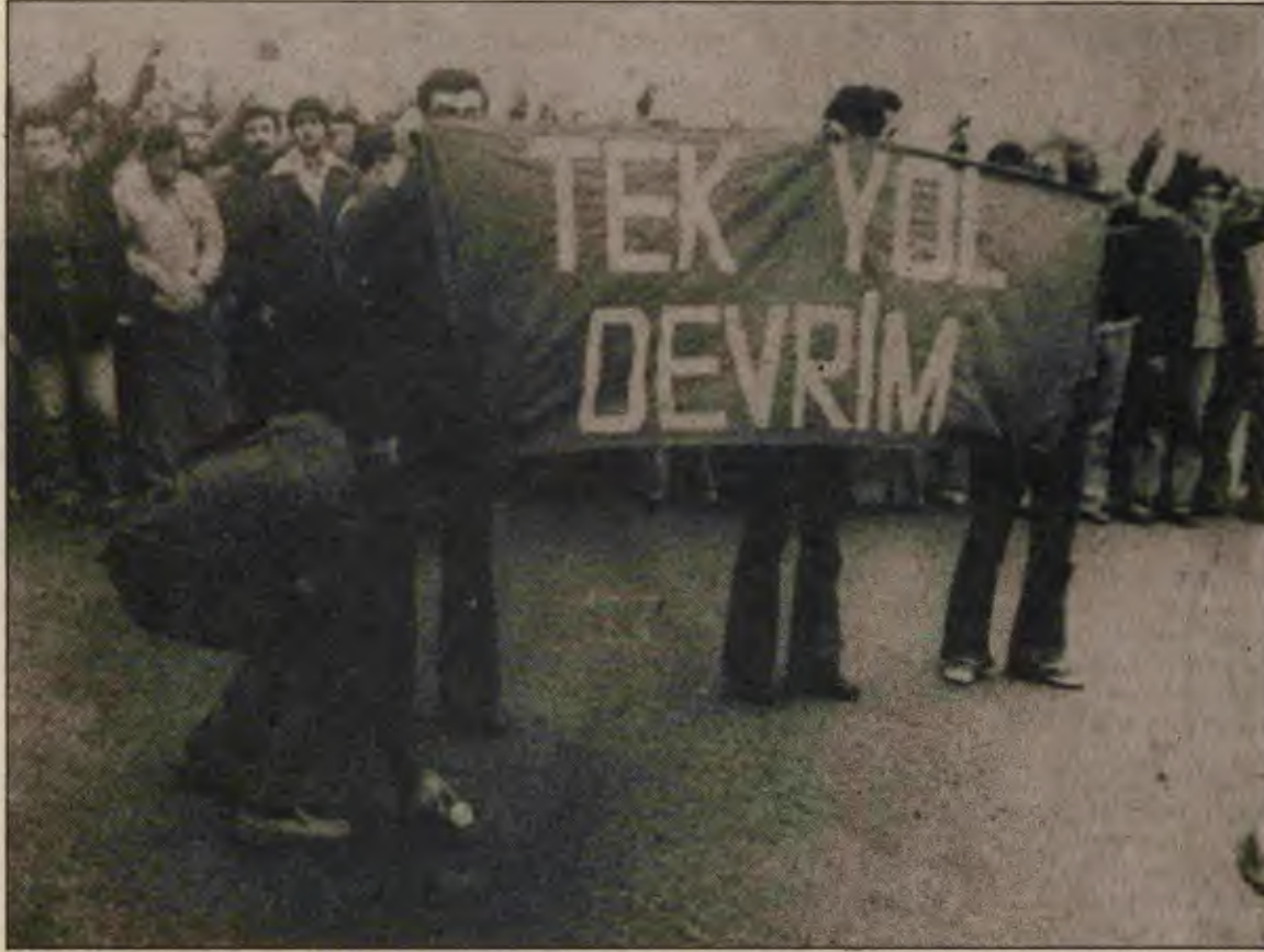
Öğrenci gençliğe on yılların mirası olan devrimci mücadele ruhunu, komünist temelde, yığınların içinde ve militan eylemin en başında yer alarak geliştirelim. Komünist öncülüğü sağlayalım.

dönümünde yapılan, en önde yoldaşlarımızın ve sempatanlarımızın olduğu yığınsal ve militan eylem, BYYO'nun devrimci işgali birer kazanım, öğrenci gençliğin coşkusunun ve kavgaya geleceğinin birer nişanıdır.