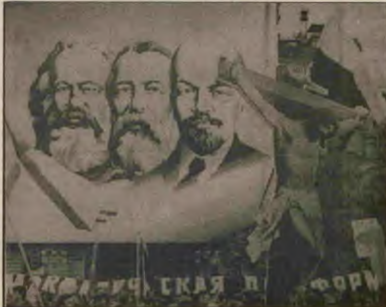
Karşı-devrimciler Gorbaçof yönetiminden yüz bulmasalar, 1 Mayıs'ta Marks'in, Engels'in, Lenin'in karşısında İsa'yı havaya kaldıramazlardı.

"Partimiz şu ana kadar bir entellektüeller partisi oldu, üyelerin çoğu aydınlar, öğrenci ve emeklilerdir" diyen Jirinovski, "entellektüelleri tercih ettiklerini" ekliyor. ( Moscow News , 6-13 Mayıs 1990) Biz bunda şaşılacak birşey görmüyoruz. Bu görüşlerle, Batı hayranı uyuz entellektüellerin, bir de Gorbi'nin göz koyduğu "kooperatifçi" kapitalistlerin dışında kime seslenebilecek ki?