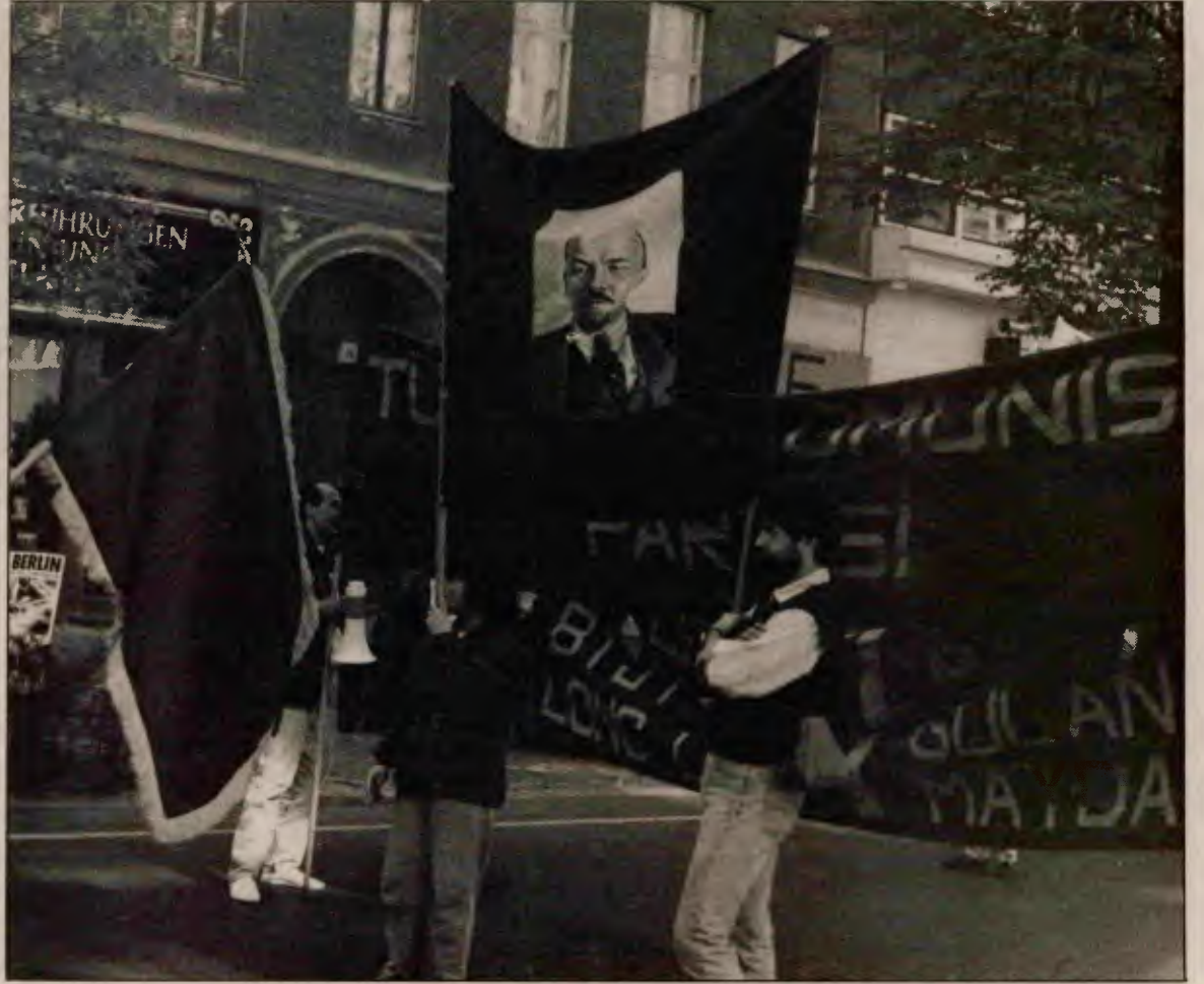
Sosyalist ülkelerden esen karşı-devrimci rüzgarlara

Bu 1 Mayıs'tan sonra küçük burjuva sol hareketlerde gerileme var. İşçi sınıfının, işçi sınıfı devrimcisi komünistlerin ise gerilemeleri için hiçbir neden yok. Üstelik küçük burjuva solların gerilemesiyle komünist öncüye duyulan gereksinim daha da çıplak olarak ortaya çıkmakta, ek bir fırsat doğmaktadır. Şimdi 1 Mayıs'tan çıkan derslerin de ışığında, yoldaşlarımızı, örgütümüzü sınıfın içine daha derinlemesine dalma, sınıfa daha iyi öncülük yapma görevi bekliyor.