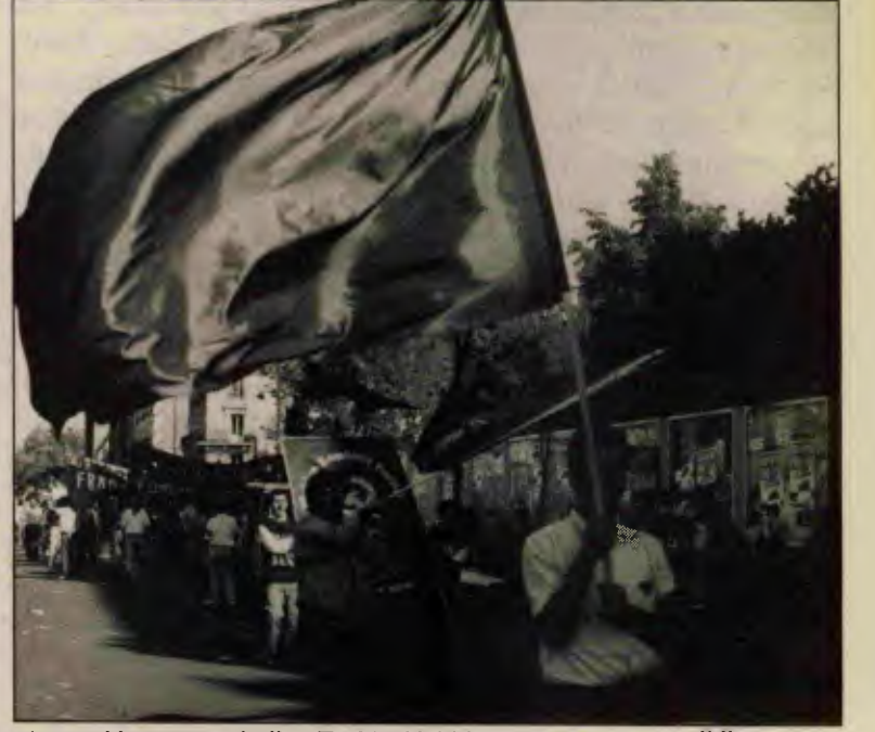
Avrupa'da yaşayan işçiler, Türkiye'deki kavgaya omuz vermelidir.

İkinci nokta şu: Alanda toplandıktan kısa bir süre sonra, bir gurup ile polisin arasında çatışma çıkması, Türkiyeli örgütlerin çoğunda panik yarattı. Bazıları alandan ayrıldılar yürüyüşü terkettiler. Böyle ufak bir çatışma yüzünden alandan kaçılırsa, bu arkadaşlar Türkiye'de hiçbir zaman 1 Mayıs'ı kutlayamayacaklar demektir. Bunlar arasında