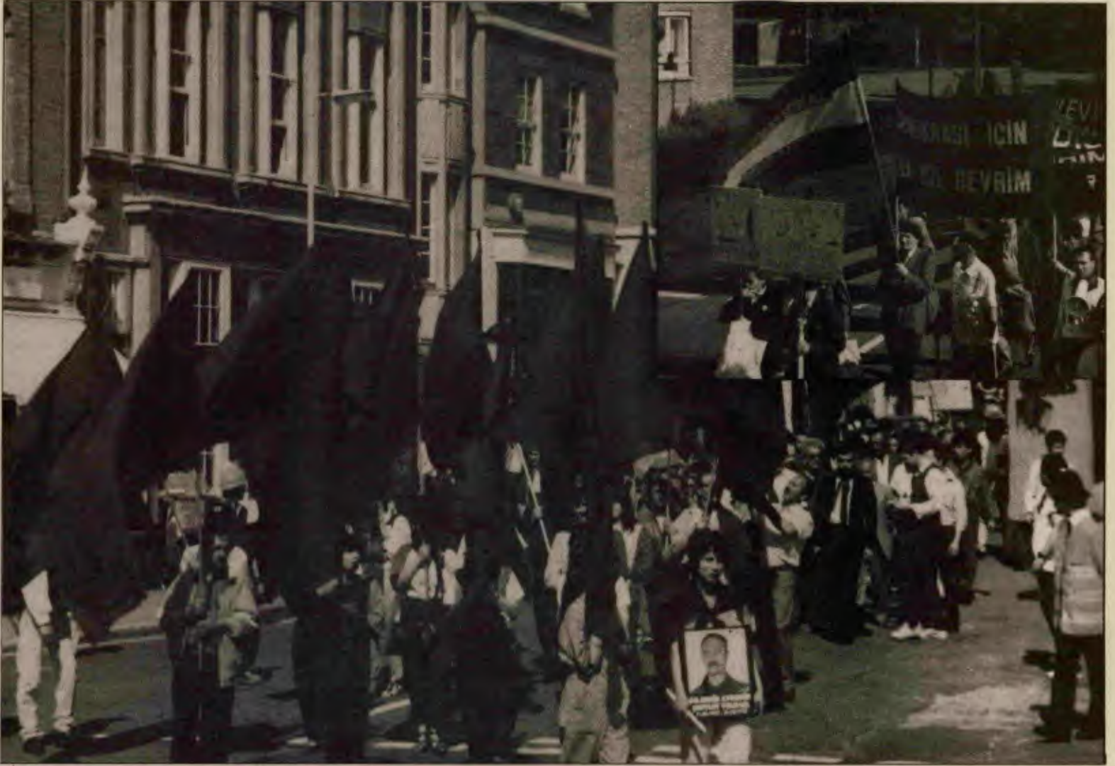
İngiltere'de 1 Mayıs'ı, Türkiye işçi sınıfının "işçiler birleşin iktidara yerleşin" sloganında yansıyan kararlılıkla kutladık.

Gorbaçov'a hain dememiz ortalığı karıştırdı