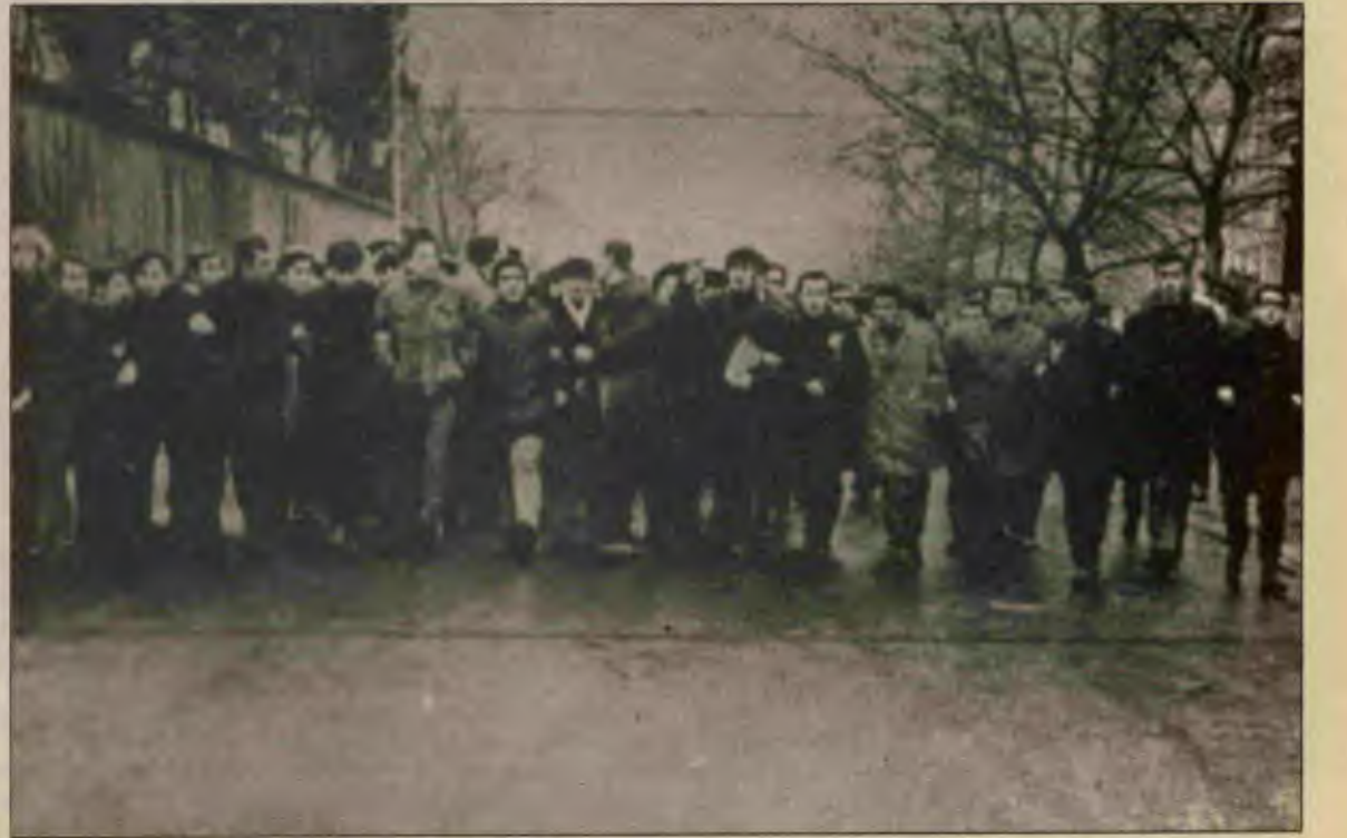
Biz eski Dev-Genç'in savaştan mirasına da sahip çıkıyoruz.

Kaldı ki, bugün , kastedilen türden sokak eylemleri de kendi başına birşey anlatmıyor. Hele gençlik alanında bir dönemece geldiğimizden, bu, daha çıplak görülüyor. Bugün Türkiye öyle bir durumda ki, "gizlice yapılan eylemler" rizikosu daha az eylemlerdir . Üç kişi yan yana geldi mi korsan koyuyor. Gençlik salkımı başlarken, kendi kimliğini duyurması açısından bu tür eylemler çok anlamlıydı. Ama bugün bunlar yeterli değildir. Militanlığı bunlar sergilemiyor. Bugün, dar değil, ne kadar geniş kalabalıkla burjuvazinin üstüne üstüne açıktan yürüyebiliyorsan, (Devamı 10. sayfada)