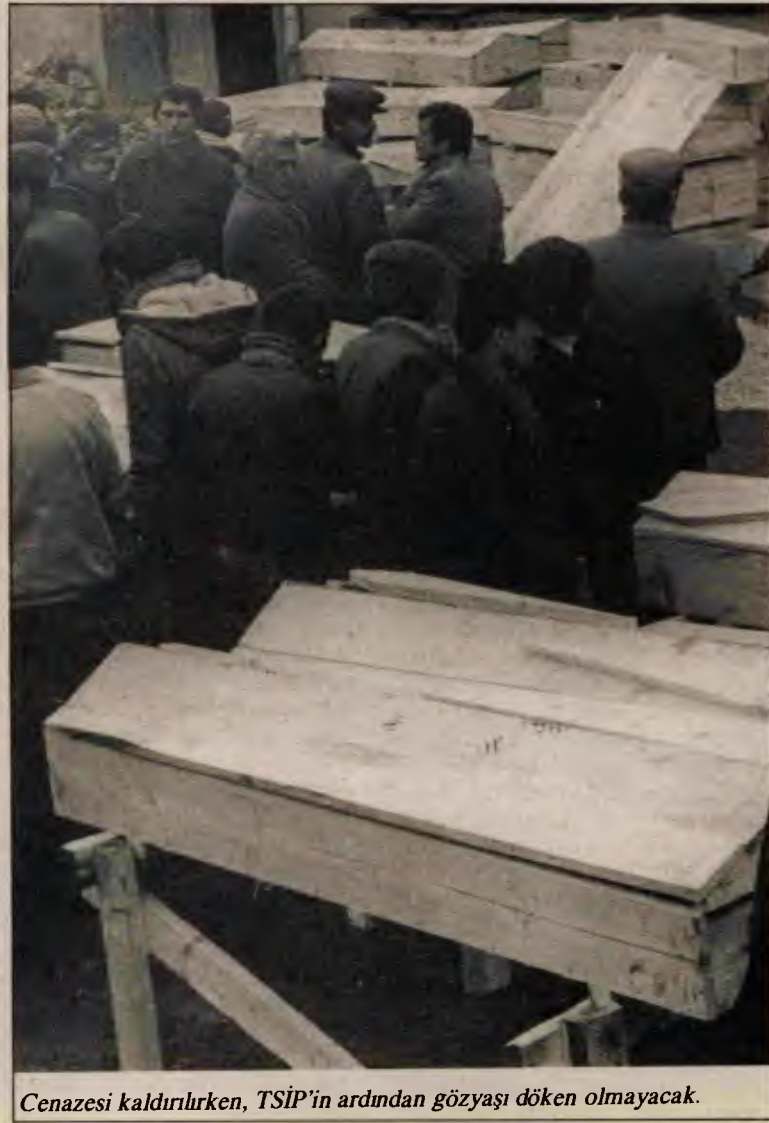
Cenazesi kaldırılırken, TSİP'in ardından gözyaşı dökemeyecek.