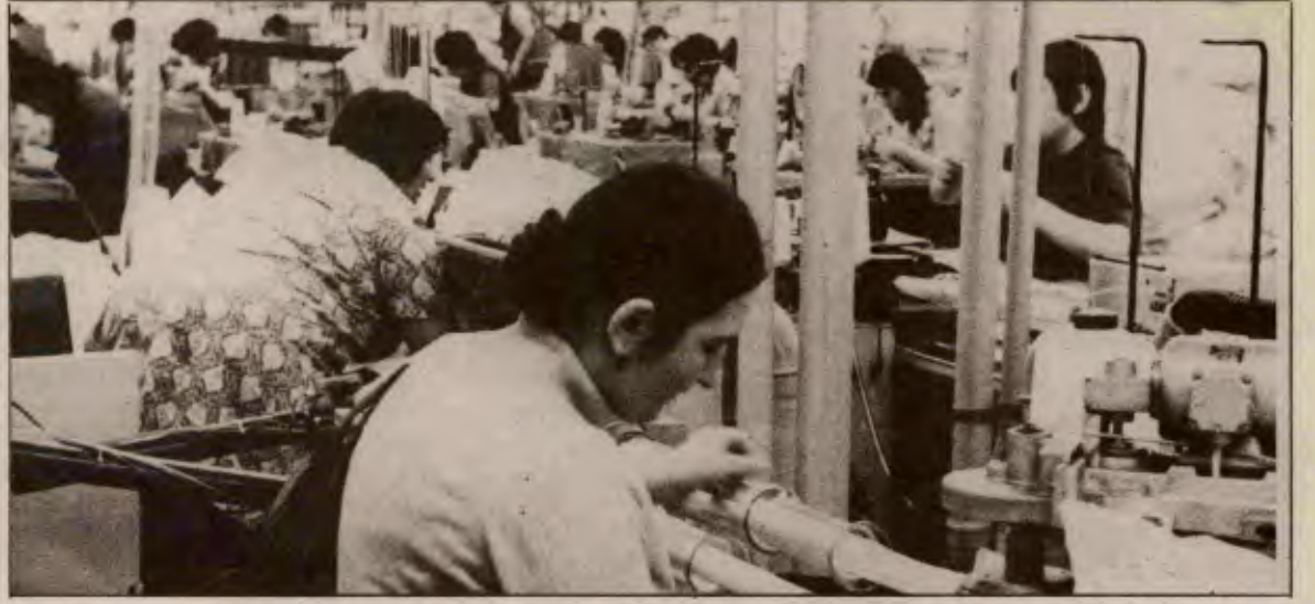
Bir Sümerbank işçisi konuşuyor