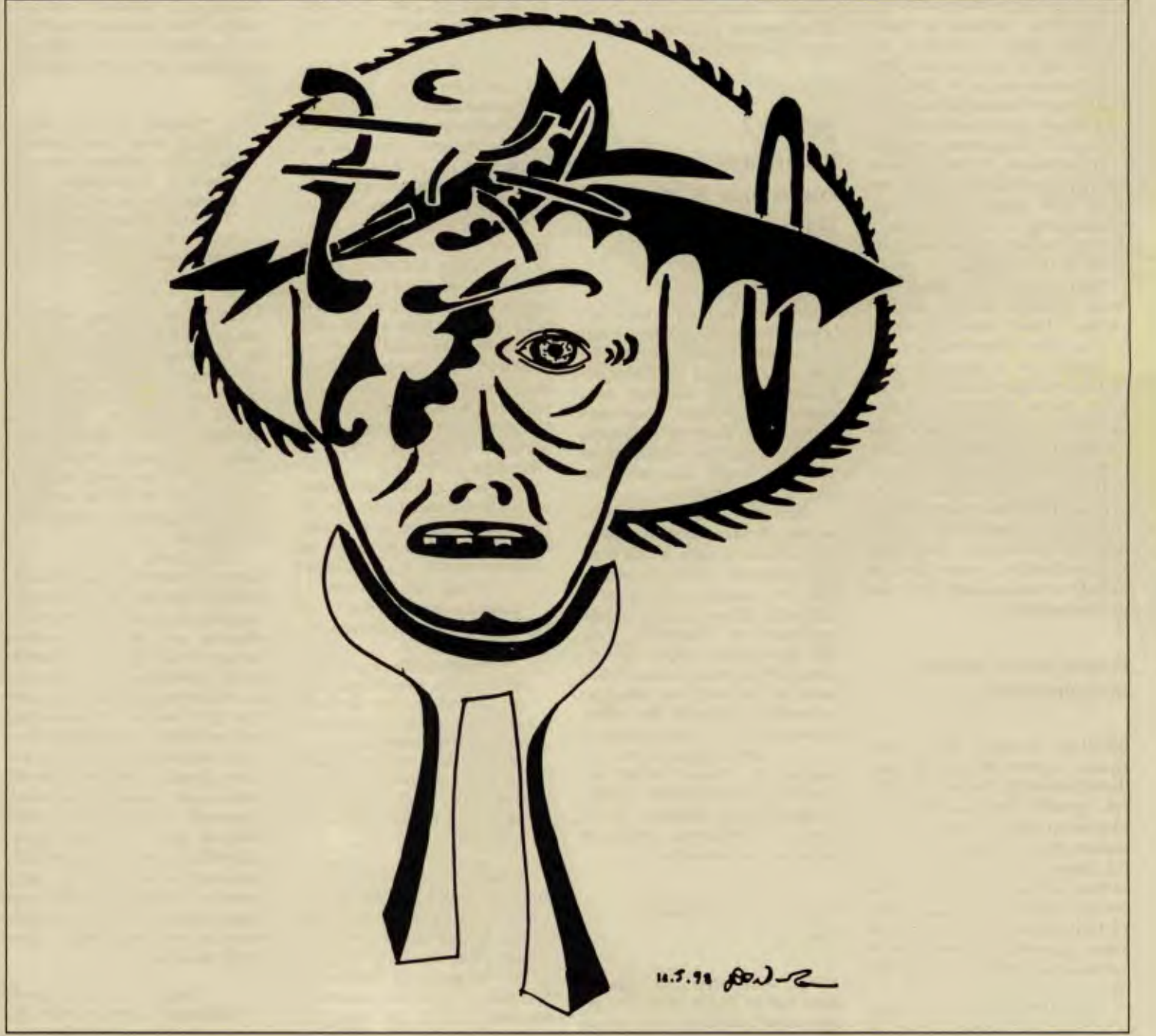
Kapitalizmde insan dediğin üç dişi kalmış canavar!

Bu güçler insanları fiziksel, psikolojik, toplumsal, ekonomik,