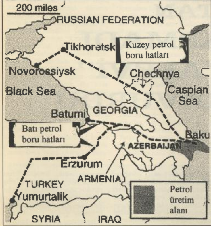
Emperyalizm petrol için Orta Asya'da yeni haritalar hazırlamaya her zaman hazırdır. Bütün tarihi bunun kanıtıdır.

Her zaman kâr güdüsünden başka ana güdüsü olmayan emperyalizm, en basit insan haklarının bile bundan çok çok sonra geldiğini sürekli gösteriyor. Bu güdüyü kamçulamak için dünya ticareti ellerinde birer sopadır.