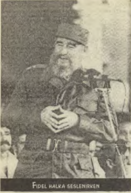
FİDEL HALKA SESLENİRKEN

hemen içinde yeralan uçaklara karşı kazandığımızı söylemek yeterlidir sanırım.