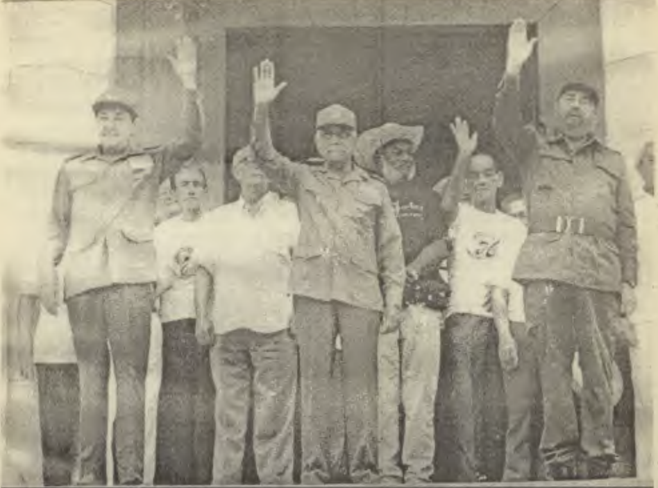
Che'lere ve Che'leri doğuran halka selam

lemeye başladılar. Bu başkaldırı birlikleri farklı yönere doğru ilerleyerek yeni savaş alanları oluşturdular. Ben birkaç adamla kumanda pozisyonunda kaldım.