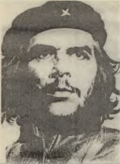
Ernesto Che Guevara

adamla, karayolu üzerinden ve başka yollardan bu şehirden gönderilen desteklerle, arkalarında tanklar da olmak üzere, düşmanın en iyi binlerce askerine karşı başladı. Guisa, 11 gün süren yoğun çatışmalardan sonra ele geçirilen silahlarla ve katılan yeni güçlerle, 30 Kasım 1953'de ele geçirildi.