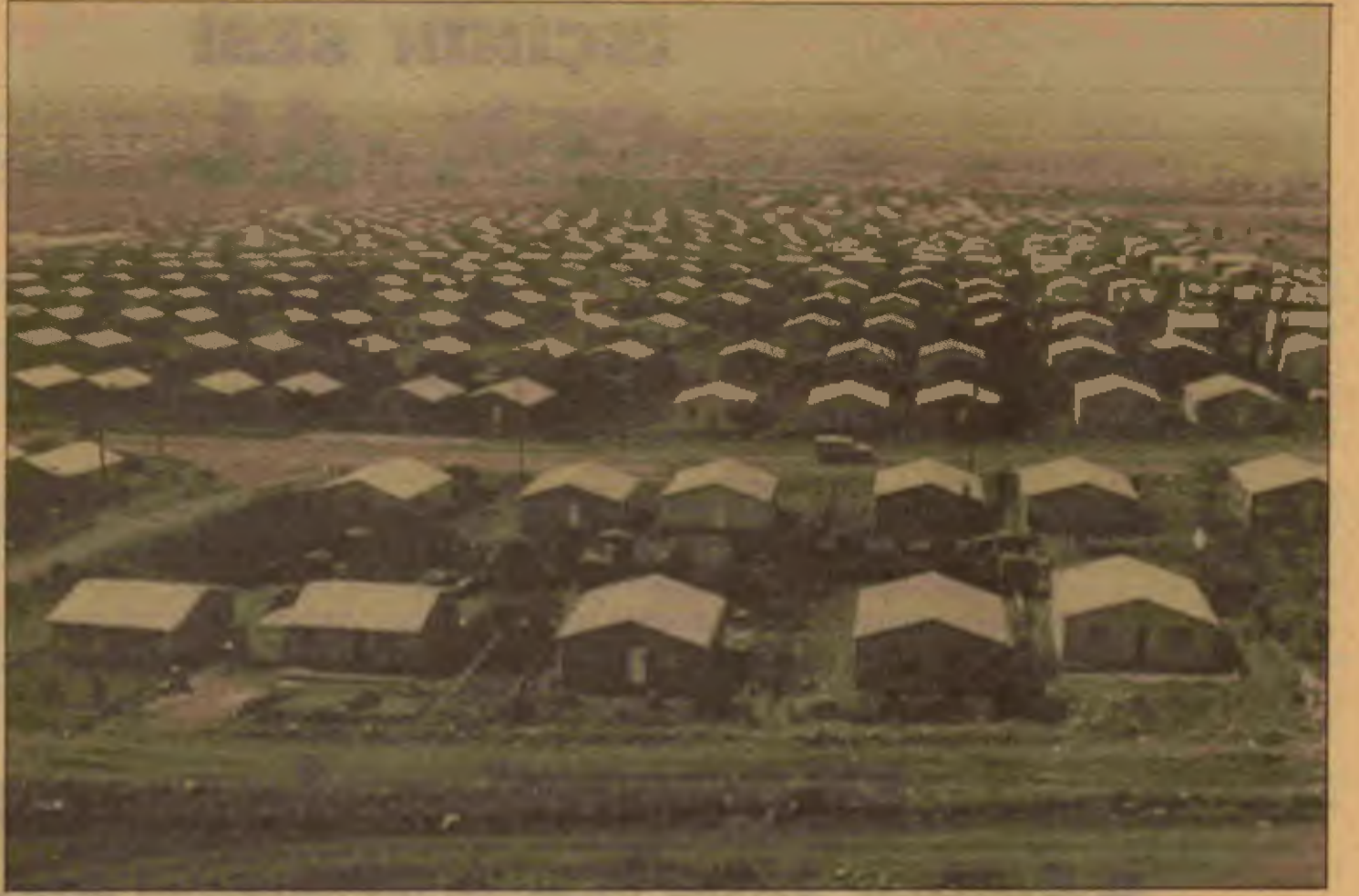
Soweto'nun genel görünümü

Anlaşma öncesi siyaset neydi? Güney Afrika propaganda makinalarının söylediklerine bakılırsa, cephe devletlerine karşı izlenen siyaset genel olarak dostça işbirliği aramaya yönelmiştir. Özel olarak Mozambik'e karşı izlenen siyaset de yalnızca sınırlardan Güney Afrika'ya silahlı devrimci saldırıyı önlemek için ANC-Umkhonto kamplarına girişilen saldırıyla ilgilidir. Durum böyleyse, neden MNR köpekleri, ANC'nin üslerine değil de daha çok asıl hedefleri olan Mozambik'in önemli endüstri ve ulaşım merkezlerine saldırıyorlar? MNR, Güney Afrika'nın Mozambik'teki delegesiydi, belki de hâlâ öyledir. Onun amaç ve hedefleri Güney Afrika'nın amaç ve hedefleridir. Bu hedefler, ANC'nin ırkçılığa karşı devrimci çabalarına asla önleyemedi ama Frelimo hükümetine, onun Mozambik'i yeniden kurma ve geliştirme çabalarına her zaman zarar verdi. Şimdi ANC'nin Mozambik'teki varlığı ciddi olarak azaltıldığından dolayı artık Güney Afrika'nın Frelimo hükümetinin