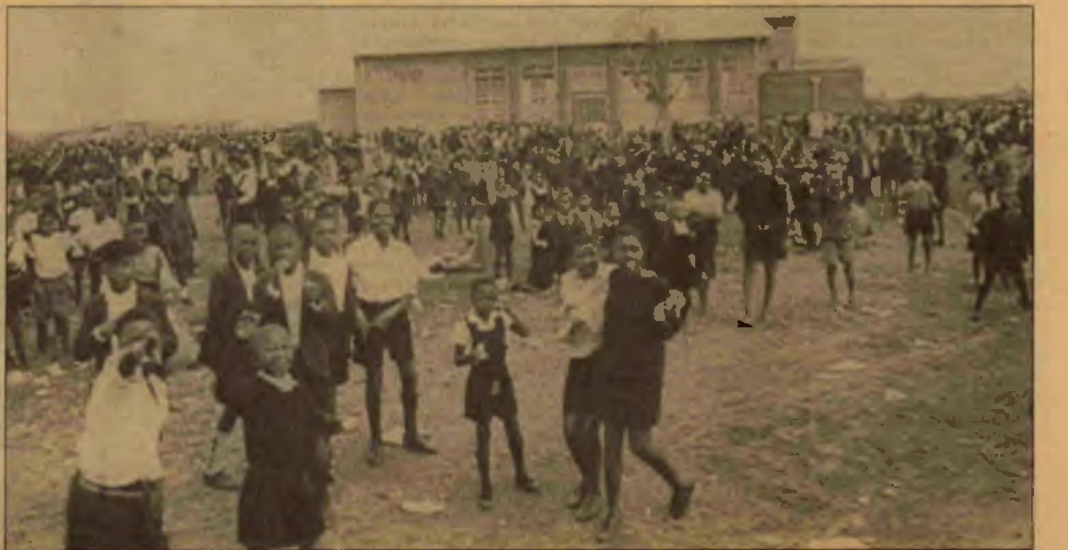
Soweto'da bir okul bahçesi

Nkomati Anlaşması'nın önümüze çıkardığı engelleri, ülke içindeki devrimci süreci pekiştirerek ve genişleterek göğüsleyelim. Mücadeleleriyle kurtuluş hareketimizin köklerini besleyen halkımızın bizi asla yarı yolda bırakmayacağından her zaman emin olabiliriz.