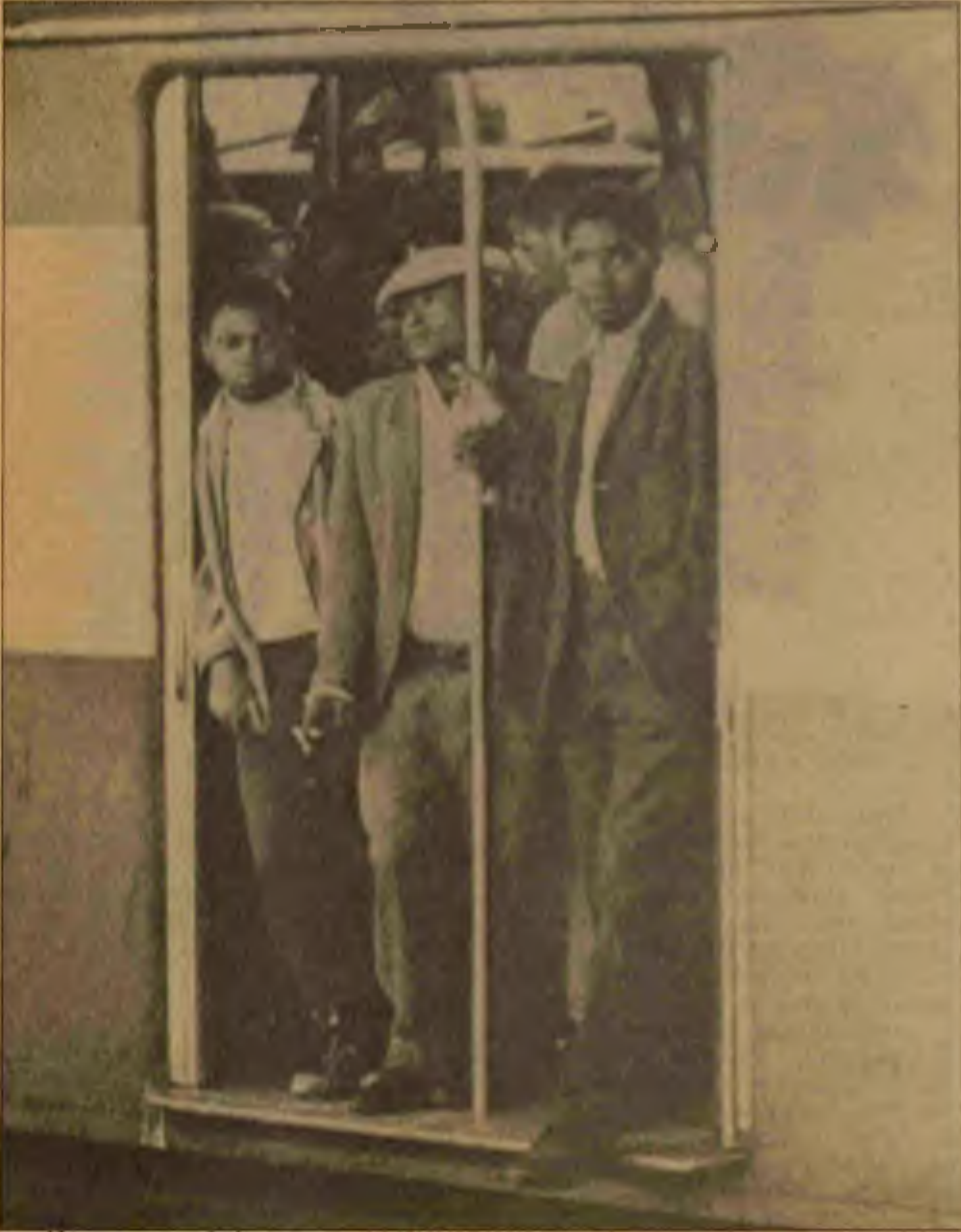
Siyahlar üçüncü mevkide gider

Afrika — ve Güney Afrika — bu global stratejinin dışında değildir. Orada ABD'nin amaçlarına hizmet edecek kadar uysal ve rüşvetle iş görmeye hazır devletler vardır. Polis devleti terörü ile varlıklarını sürdüren ve siyah çoğunluğa baskı uygulayan rejimler için ABD desteği ve yardımı hazırdır. Öyleyse, Namibya'nın haksız işgali ve askeri diktatörlüğü kabul edilebilirdi. Bütün bunlar Washington'un öngördüğü "komünizmin konumlarını geriye itme", rekabet ve bir kıtayı kâr dünyasında uysal bir dışli olabilecek biçimde yeniden