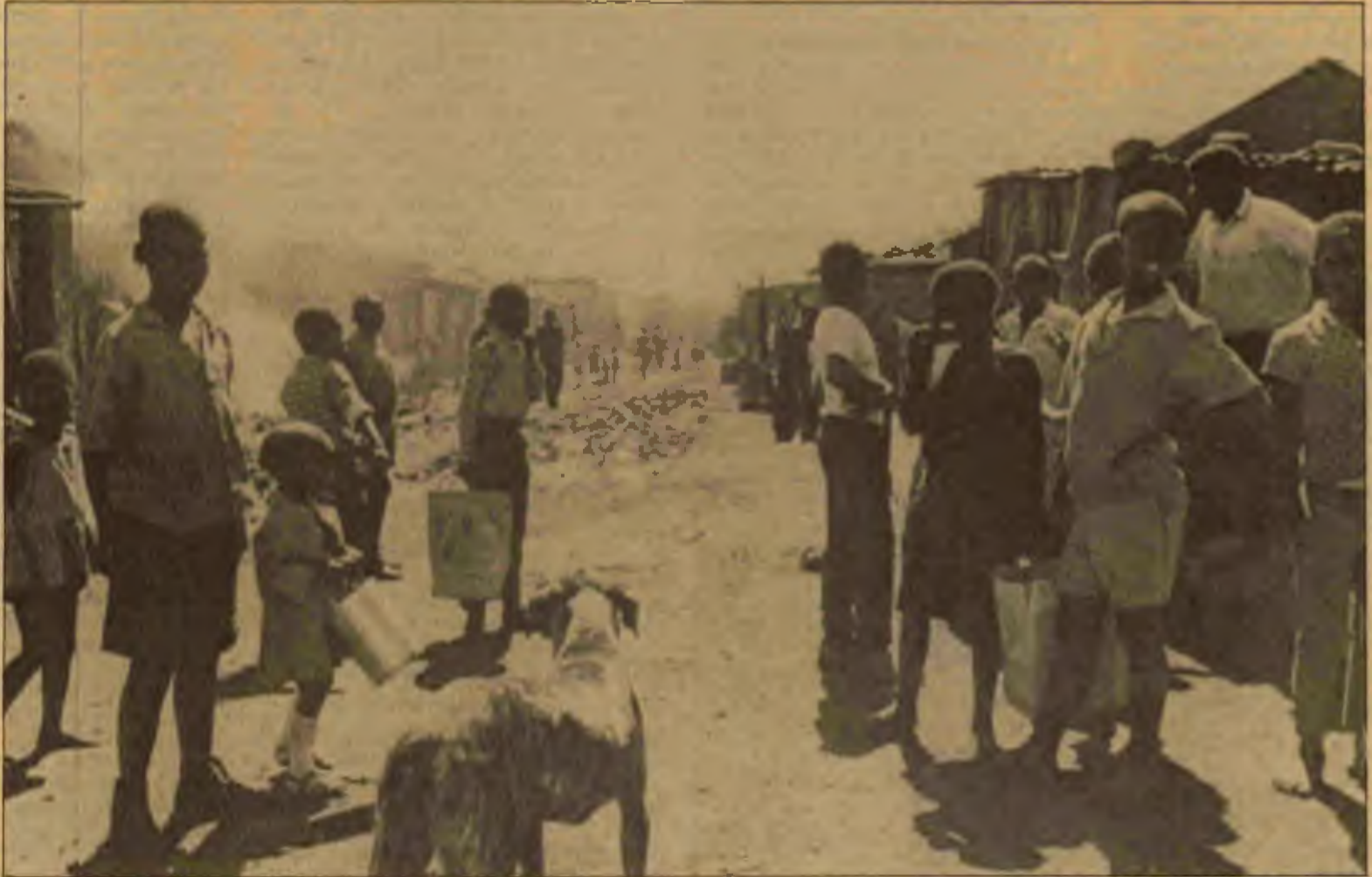
Dünyanın en modern şehirlerinden biri olan başkent Johannesburg yakınlarında kurulu yalnızca siyahların yaşadığı 1 milyonluk Soweto şehriden bir görüntü

B ir kez daha anladık ki geleceğin neler getireceği önceden kestirilemez. Bir yıl önce, Afrika'daki siyasal gelişmeleri kim tahmin edebilir, son aylardaki olayları kim önceden görebilirdi? Hangi araştırmacı Frelimo partisinin yönettiği Mozambik hükümetinin nisan 1984'te Güney Afrikalı devrimci kadroları sınır dışı edeceğini söyleyebilirdi? Kim Mozambik-Güney Afrika komisyonunun ortak denetimi altında Afrika Ulusal Kongresi (ANC) üyelerinin evlerine ve Maputo'daki binalarına baskınlar düzenleneceğini öngörecektir kadar cesaretli konuşabilirdi?