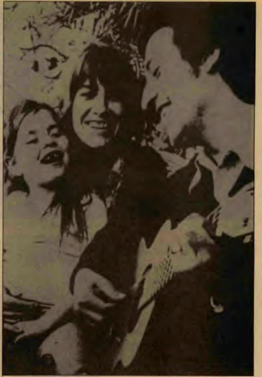
Faşist cuntanın katlettiği yiğit sanatçı Victor Jara.

Öte yandan, Demokratik İttifak'ın içinde olan Hıristiyan Sol, Komünist Partisi'yle görüşmeler yapmakta ve ŞKP'nin İttifak'a katılması veya en azından destek vermesi için uğraşmaktadır. Şimdiye kadar ŞKP bu tür önerileri reddetti. ŞKP ülkede faşizmin yıkılması ve ülkenin demokratikleştirilmesi konusunda burjuva muhalefetin sınırlılığını çok iyi saptamış bulunuyor. Ayrıca burjuva muhalefetin demokrasi tellallığının kapitalizmin korunmasıyla bağlı olduğunu, sistem içinde kalarak Pinochet'ye alternatif arandığını da görüyor. Pinochet faşizmini yılmak ve ülkeyi gerçek demokrasi yoluna sokmak için devrim yolundan ilerlemenin zorunluluğunu vurguluyor. ŞKP şimdilik, hem burjuva muhalefet içinde yeralan sosyal demokratların bu yolda yürümeye yetenekli olmadığını sergiliyor, hem de ülkenin radikal-demokrat ve Marksizm'den esinlenen küçük burjuva hareketlerini etrafında toparlama, MIR'le oluşturduğu ittifakı güçlendirme yolundan yürüyor.