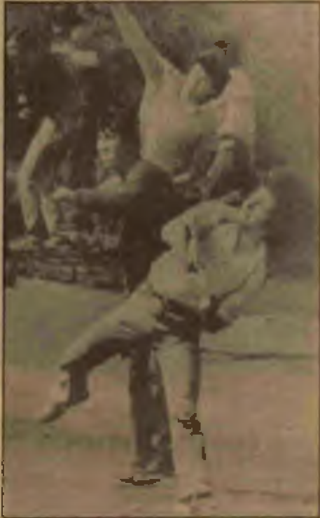
Faşizm yıllarının halk arasında biriktirdiği öfke sokak gösterilerinde patlıyor.

— Pinochet faşist Nasyonal Parti'nin platformundan bir konuşma yapıyor.