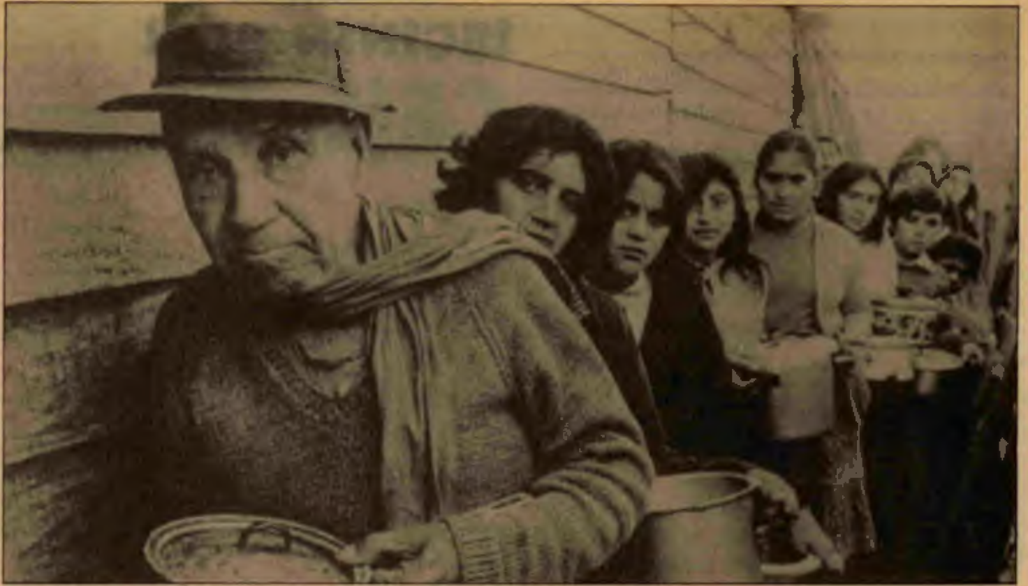
Santiago aşevinin önünde kuyruk.

Faşist cuntanın başa gelişinin onuncu yıldönümü olan 11 Eylül'de Şili gösterilerle çalkalandı. 4 kişi öldürüldü, 100 kişi yaralandı, 400 kişi tutuklandı. Gösterilerde işçiler, özellikle bakır işçileri en