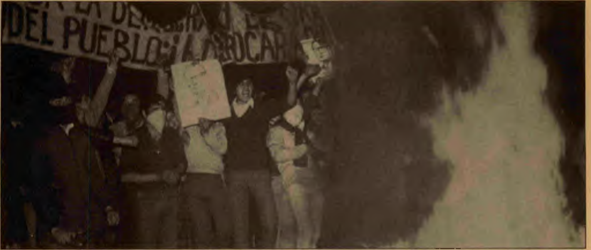
Pinochet yönetimine huncını haykıran halk yığınları faşizmi çözülmeye zorlayan ana etken oldu.