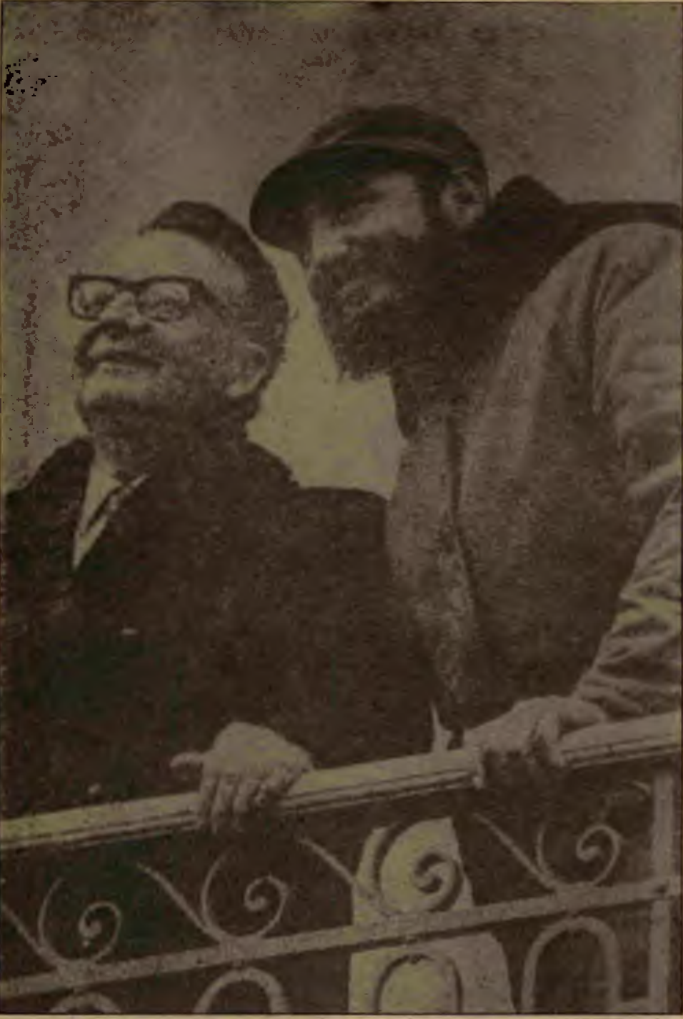
Allende, Fidel Castro ile birlikte.

Bu olayın ardından 5 general, 17 albay ve 7 yarbay olmak üzere toplam 29 karabineri subayı istifa etti veya ettirildi. Bunlara cuntanın ileri gelenlerinden karabineri komutanı Cesar Mendoza da dahil.