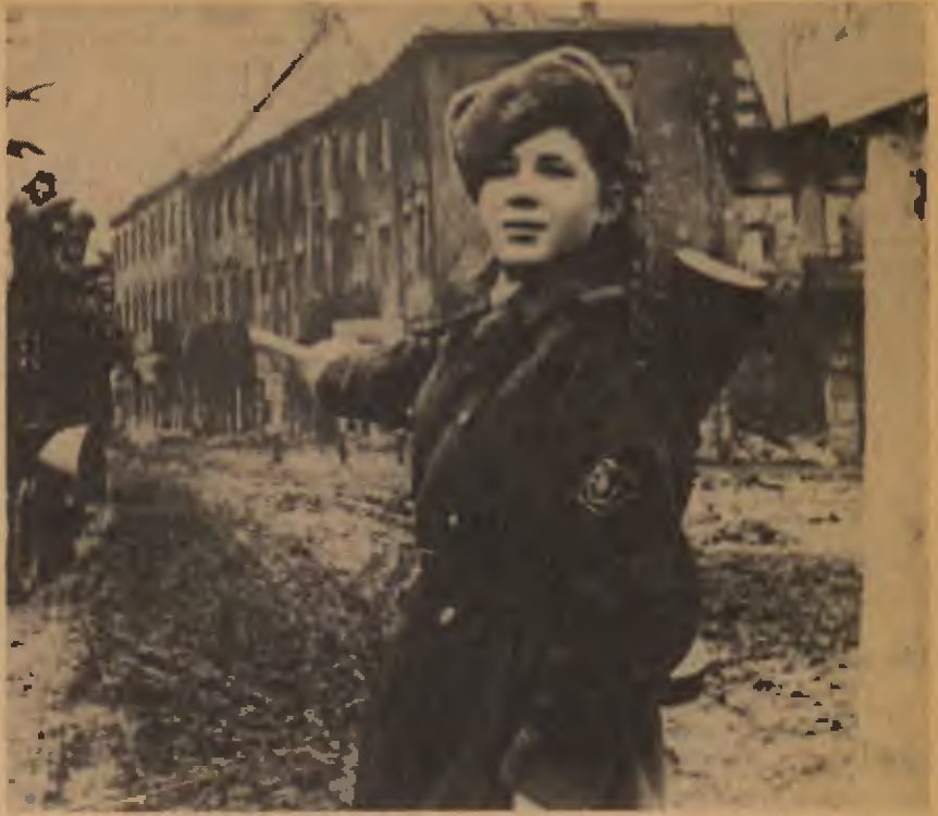
Sovyet kadını II. Dünya Savaşı'nda proletarya devletini silahlı korudu.

Burjuvazi ahlak kurallarını "ebedi doğru" olarak gösterirken şöyle bir mantık oyunu yapar. Önce, basit bazı verisel saptamaları ebedi doğru olarak gösterir. Örneğin "Napolyon 5 Mayıs 1821'de öldü". Sonra buradan benzetmeyle kendi çıkarlarına uygun kuralları da ebedi doğru olarak gösterir. Napolyon'un ölüm tarihi nasıl doğrudur, benim ahlak anlayışım da öyle kalıcı bir doğrudur der. Oysa, bir kez, doğa bilimlerinde bile ebedi doğrular çok azdır, yine de böyle düzeysiz saptamaları gerçek anlamda ebedi doğruya örnek göstermek yanlıştır. Ayrıca, toplum bilimlerinde ebedi doğrular çok daha azdır. Ahlak kurallarına ilişkin bir ebedi doğru arıyorsak bu olsa olsa ahlak kurallarının, üretim biçimine, egemen sınıfa göre değiştiğidir.