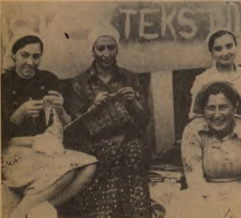
Devrimci durum yıllarında işçi kadınlarımız sınıf savaşında aktif yer aldılar.

Lenin, parti ve yığınların içinden, "bey ve efendi" ideolojisini en son izine kadar silip atmak gerek diyor. Bu ahlak