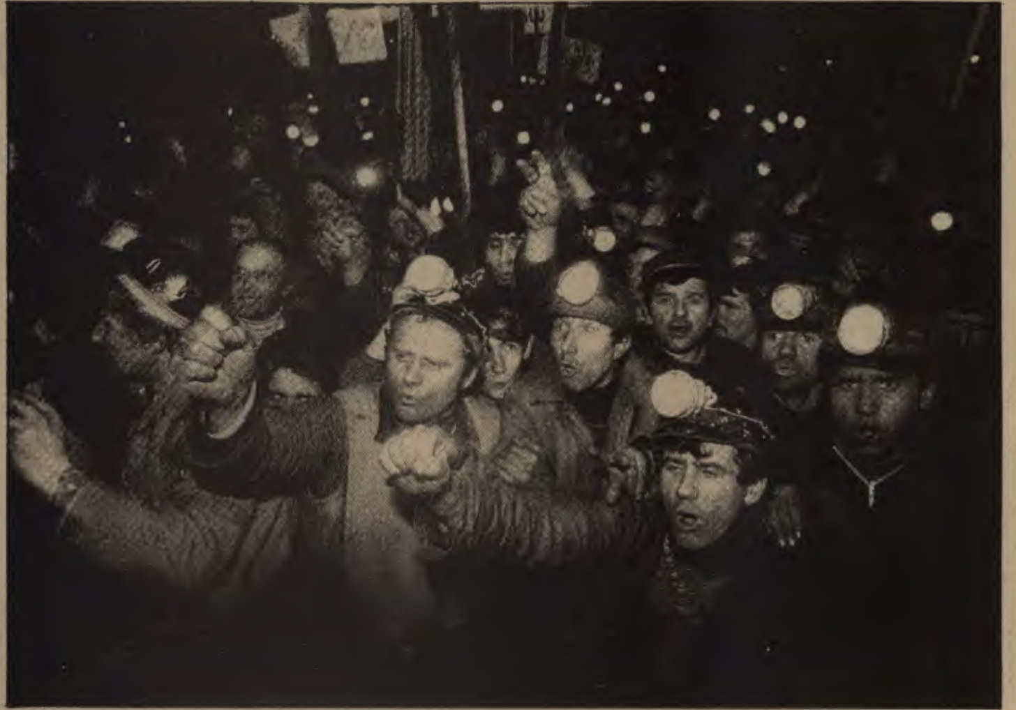
Karşı-devrim, işçi sınıfını siyasal erkten uzaklaştırdı, RKP'yi illegal yaptı. Ancak herşeye rağmen, kapitalistlerin, ağaların 43 yıl sonra yeniden geri gelişini protesto eden Romanya işçileri, sokakları işgal edip komünistlerin kellesini isteyen karşı-devrimci kalabalıkları, yine sokaklarda

Görüldüğü gibi, indikçe iniyorlar. Bu rakam bile kesin olmayabilir. Dahası, bu rakamın büyük bölümü, fırsat bu fırsat,