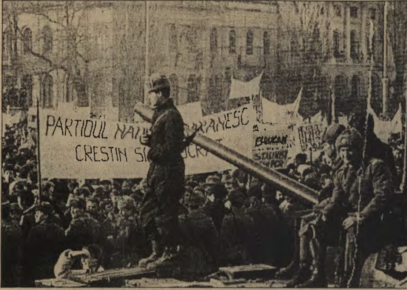
sopayla dağıtıyorlar. Gorbaçovcular ise, kendi yaratımları olan ve işbirliği yapmak istedikleri Batıcı karşı-devrimcilerle öfkeli işçiler arasında sıkışık kalmış durumdadırlar. Sağ tarafta karşı-devrimci göstericilerin, solda da buna yanıt veren işçilerin fotoğrafları yer alıyor.