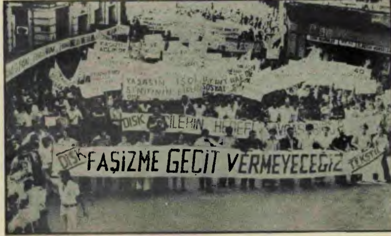
DİSK'TE BİRLEŞEN YİĞİNLAR FAŞİZMI EZECEKTİR.

Türkiye Devrimci İşçi Sendikaları Konfederasyonu DİSK, Türk-İş yöneticilerinin sınıf uzlaşmacılığı politikasına karşı maden, lastik, basın ve gıda iş dalında 4 sendikadan Türk-İş'ten ayrılıp ayrı bir örgütlenmeye gitmesiyle 13 şubat 1967'de kuruldu. 1967'de sadece 30 bin üyesi