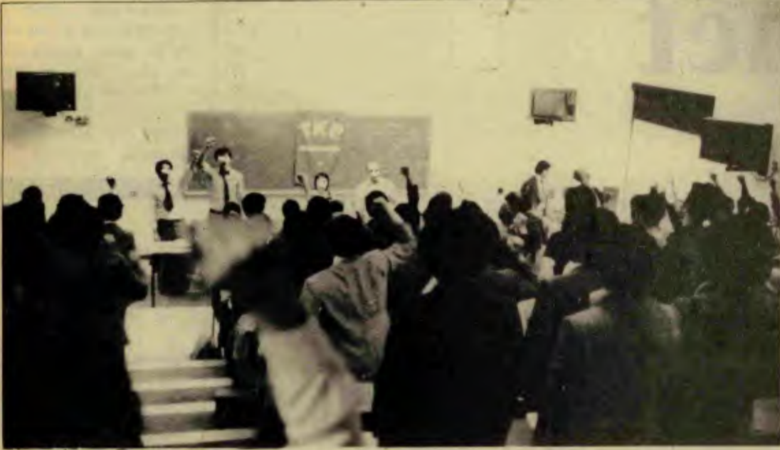
İTİB II. Bölgesel seminerinden bir görünüş

* İki günlük seminerde ileri demokrasi ve cephe konusu işlendi