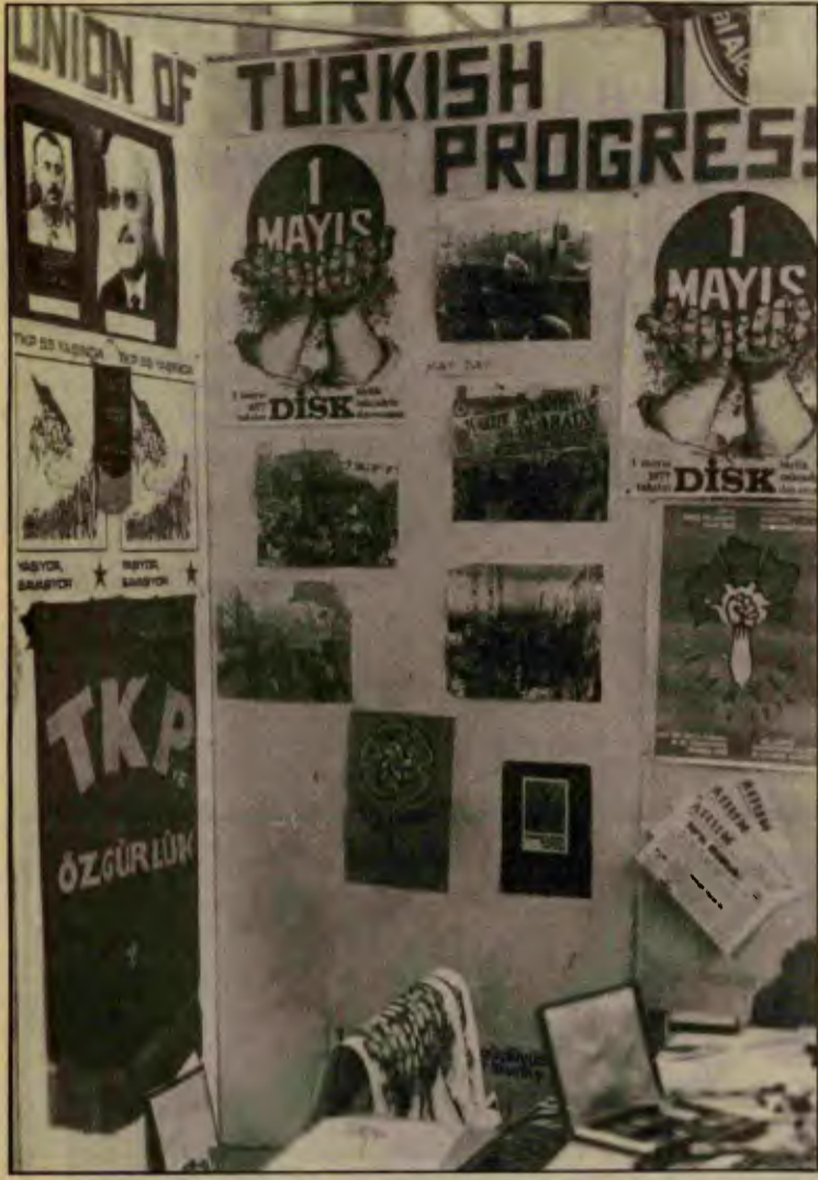
Yaz Taarruzu boyunca İTİB Türkiye işçi sınıfının ileri demokrasi savaşını duyurmak için panolar hazırlıyor, bu savaşla dayanışma sağlıyor.