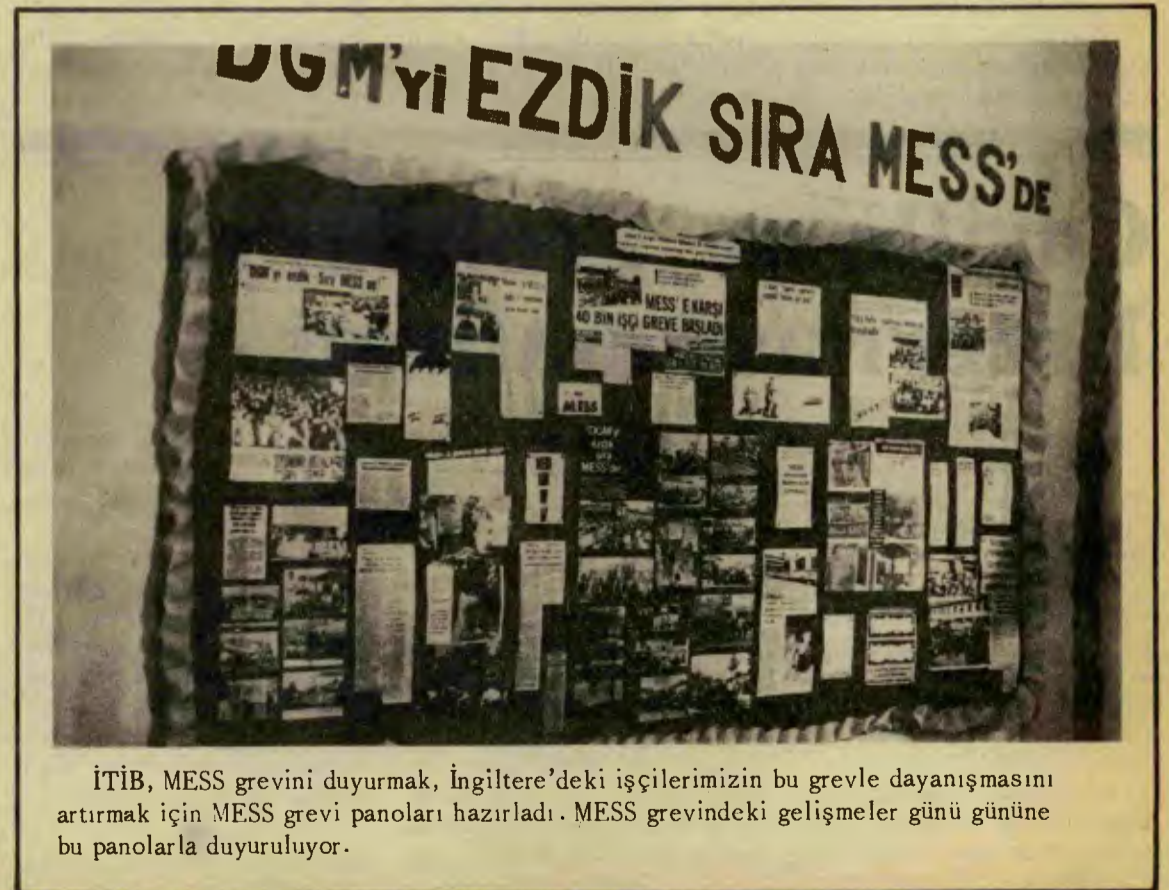
İTİB, MESS grevini duyurmak, İngiltere'deki işçilerimizin bu grevle dayanışmasını artırmak için MESS grevi panoları hazırladı. MESS grevindeki gelişmeler günü gününe bu panolarla duyuruluyor.