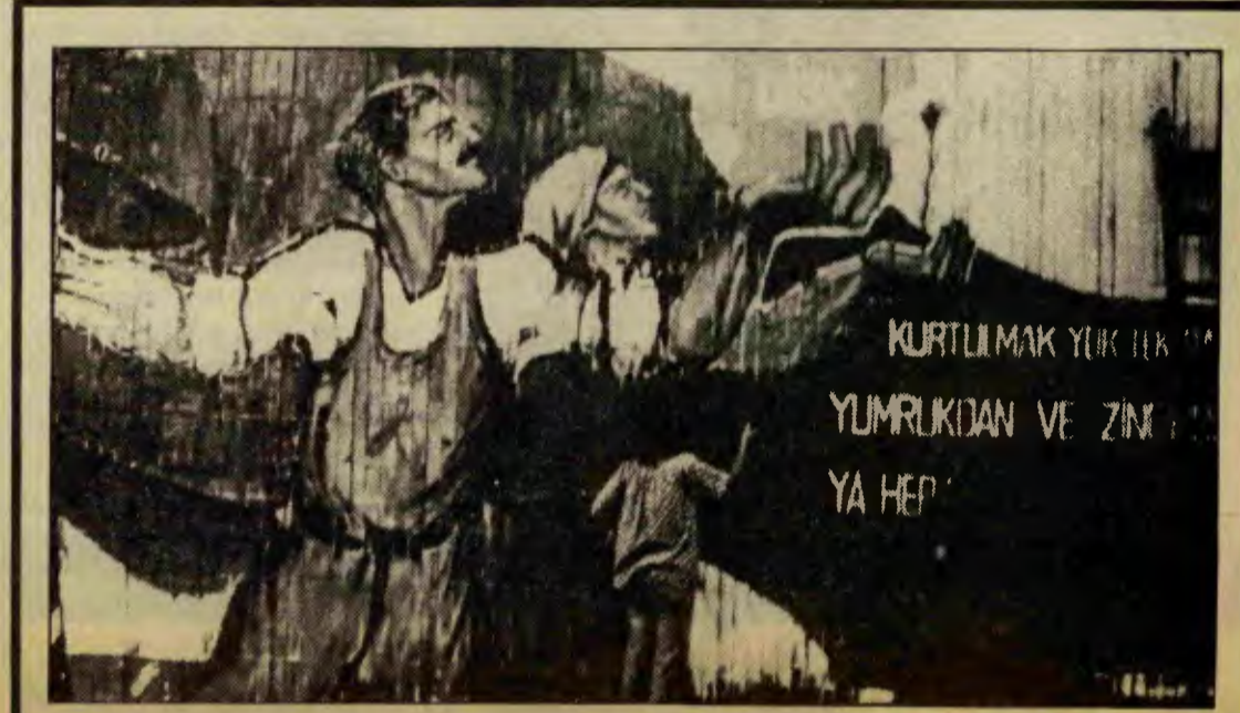
Maden-İş'in MESS'e karşı giriştiği grev, toplumun hemen her kesiminden destek alıyor. İlerici sanatçılar, grev yerlerinin duvarlarını dev panolarla süslüyorlar. İşçi İstanbul daha bir renkleniyor. Bayram yerine dönüyor.