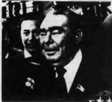
Sovyetler Birliği Komünist Partisi Genel Sekreteri Leonid Brejnev

Bu yılın Mayıs ayında Sovyetler Birliği ile ABD, SALT II adıyla bilinen Stratejik Silahları Sınırlama Anlaşması görüşmelerini tamamladılar. Anlaşma uzun menzilli savaş uçaklarının ve roket rampalarının sayılarını sınırlandırılması, diğer çeşitli silahların sayılarının düşürülmesini öngörüyor.