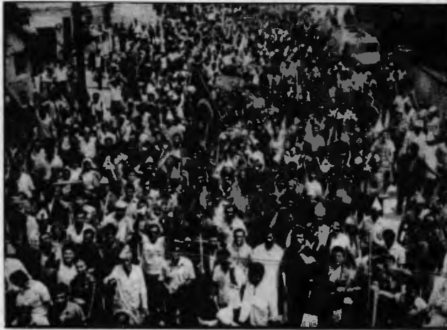
15-16 Haziran, kendiliğindenci teorilerin kör "ışığında" bile bakılsa devrimci durumun açık bir belirtisidir.

Lenin şöyle diyor: "Ne alt sınıfların ezilmesi, ne de üst sınıflar arasında bunalmış devrimi getirebilir. Eğer bir ülkenin pasif baskı durumunu aktif bir isyan ve ayaklanmaya çevirmeye yetenekli bir devrimci sınıfı yoksa, bunlar yalnızca o ülkenin çü-