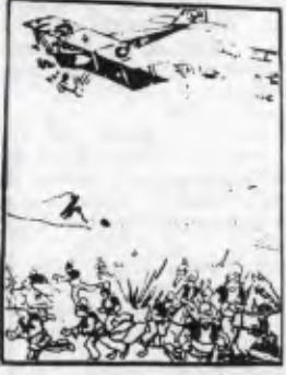
Türk burjuvazisi ayaklanan Kürtlere bomba yağdırıyor. (30 Mart 1925 tarihli Cumhuriyet'ten)