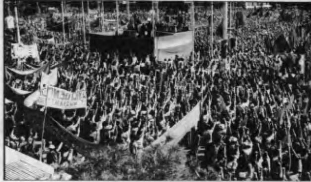
Öncü savaşa daldı mı yığınlar yiğidin ardında dizilmeye başladılar.

İşte bunun için Yürükoğlu'nun kitabı tüm sorunlara anahtar niteliği taşıyordu. Cepheye ve eylem birliğine doğrudan ve ayrıntılı olarak değinmesi de onlara Leninci yolu açıyordu. Kitabı "eleştiren" mantık hem saçtı, hem güçlüdür. Cephe ve eylem birliğini eylemin ön koşulu sayar, onlar için proletaryaya hegemonyasından, ideolojik savaştan