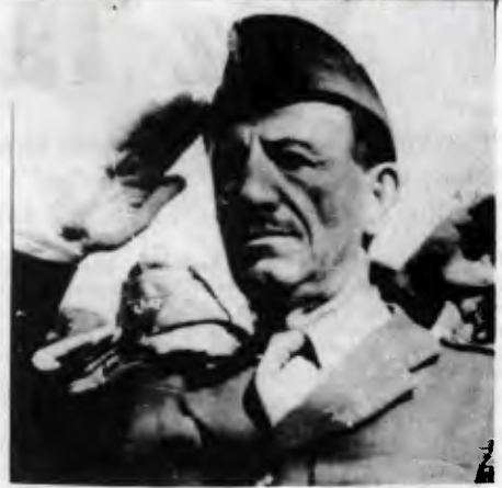
General Serafi içsavaş günlerinde

Yanıt: Tüm yaşamı boyunca Balkan dostluğu, Yunanistan ve Türkiye arasındaki ilişkilerin düzenlenmesini desteklemiştir. Askerliğinin ilk yıllarında, önce Türkler sonra da Bulgarılara karşı savaş sırasında bile bu halkların dost olması, aralarında kardeşlik bağlarının kurulması gereğine inanır. Emperyalistlerin, kendi çıkarları için bu ülkelerin birbirleri ile savaşta olduğunu görüyordu. Bu ülkeler için umudun dostluk ve kardeşlik olduğuna inanıyordu. Çünkü temelde halkların çıkarları aynıydı. Türkiye ve Yunanistan halklarının durumunu anlatmak için sık sık "aynı kazanda kaynıyoruz" deyimini kullanırdı.