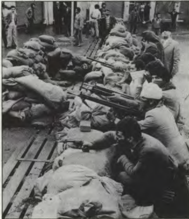
Faşist cunta, İran halkının savaşımını boğamayacaktır.

ABD emperyalistleri, en başta çaresizliğin ve Reagan yönetiminin saldırgan ve baskıcı yöntemlere düşkünlüğünün sonucu olarak Türkiye'deki rejimin durumunu pembe