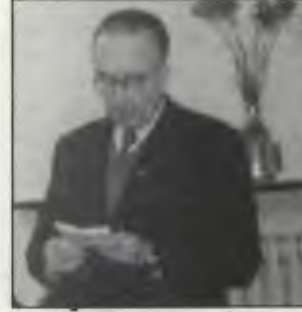
Placido, Portekizli komünistlerin faşizm deneyimlerini anlatıyor.

1974'de son bulan 48 yıllık faşizm döneminde Portekiz komünistleri faşizmin ne olduğunu iyice tanıdılar.