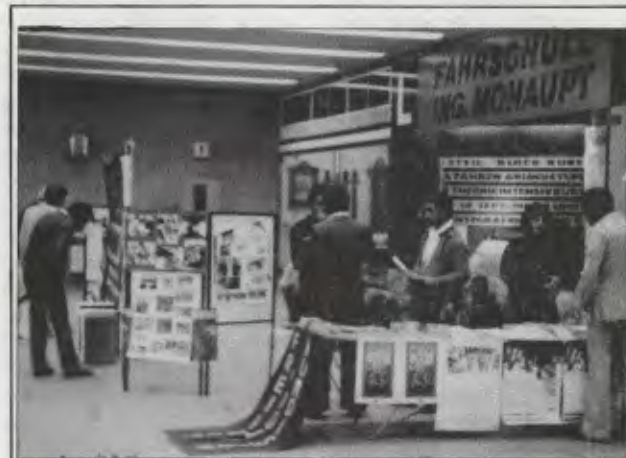
Faşist darbenin birinci yıldönümünde Viyana'da açlık grevi yapılmıştı. Yukarıda, açlık grevinin yapıldığı salon ve grevi birlikte örgütleyen örgütlerin temsilcileri, dayanışmaya gelen konuklara Türkiye'deki durum hakkında bilgi verirlerken görülüyor.