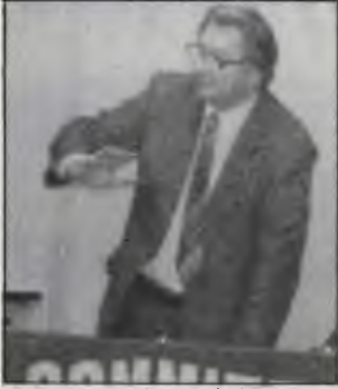
Heffer: Demokratik haklar savunulmalıdır.