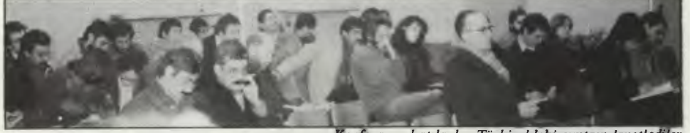
Konferansa katılanlar Türkiye'deki cuntayı lanetlediler.

Konferans, bu tür toplantıların genellikle olduğu gibi yalnızca bir iyi niyet gösterisi değildi. Aktif bir örgütlenmeyi yansıttı. Bu yönüyle, İngiltere'de şimdiye kadar örgütlen-